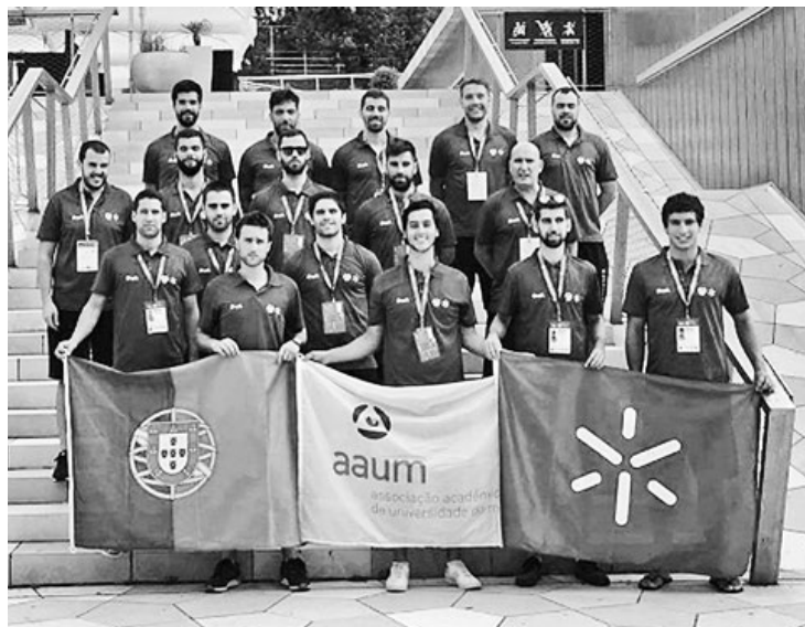
Equipa de andebol da UMinho, na Croácia, a disputar o Campeonato Europeu Universitário

Divididos entre as cidades croatas de Zagreb e Rijeka, os EUSA Games são uma das maiores competições multidesportivas organizadas durante o corrente ano. Milhares de estudantes/ atletas oriundos dos diversos cantos da Europa lutam por um lugar ao sol entre a galeria dos melhores do velho continente. A UMinho, que em 2013 foi a melhor universidade europeia no ranking da EUSA (European University Sports Association), participa nestes jogos com ambições de lutar pelos lugares do pódio quando a contagem final das medalhas estiver concluída.