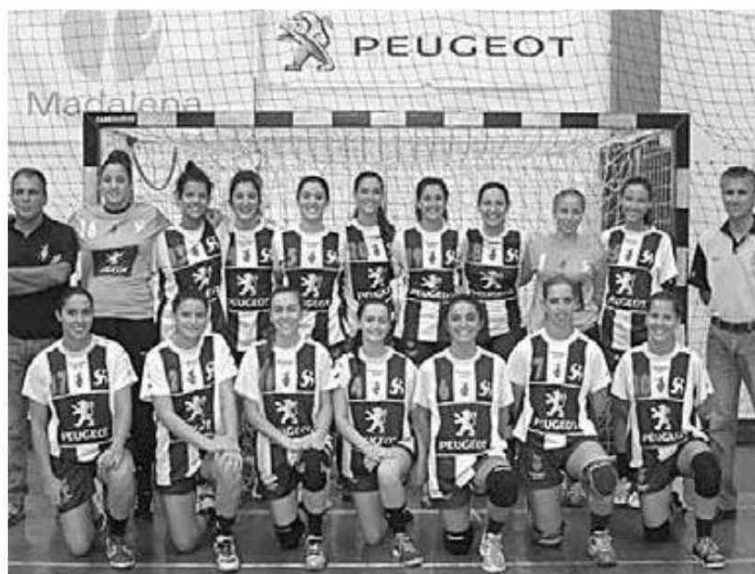
Sports Madeira na I Divisão com um plantel jovem