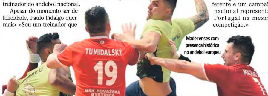
Madeirenses com presença histórica no andebol europeu

luta para que o Madeira SAD fique na história da Madeira a cada época que passa. Temos sido fortes nos últimos anos perante emblemas de orçamentos megalómanos, por isso este é um trabalho que merece ser enaltecido. Lembrando, uma vez mais, que o treinador não é o único responsável, e que sem a excelência do trabalho da estrutura do clube, e a qualidade e empenho dos atletas, nada disto seria possível.»