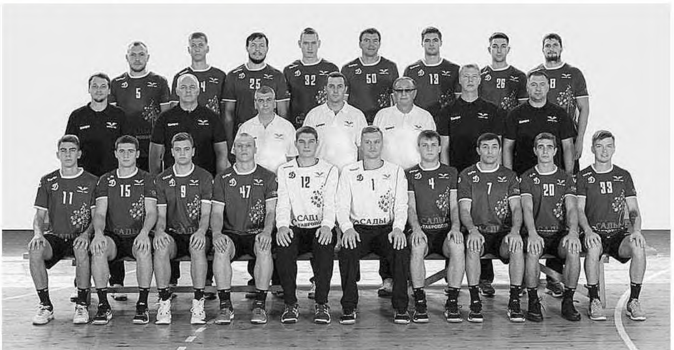
Dynamo Victor de Stavropol ocupa o sexto lugar na Liga russa.

O fuso horário entre a Madeira e esta localidade são precisamente de três horas.