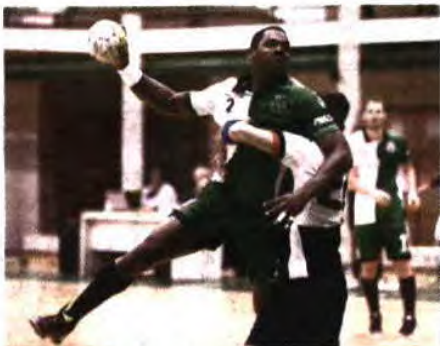
Sporting joga hoje em Santo Tirso