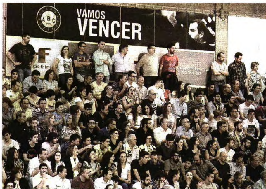
ABC quer o pavilhão esgotado, pois o público tem ajudado a equipa a vencer

Relativamente aos adeptos, que na passada quarta-feira, no jogo com o Sporting, marcaram presença em elevado número e mereceram elogios por parte dos atletas, o técnico