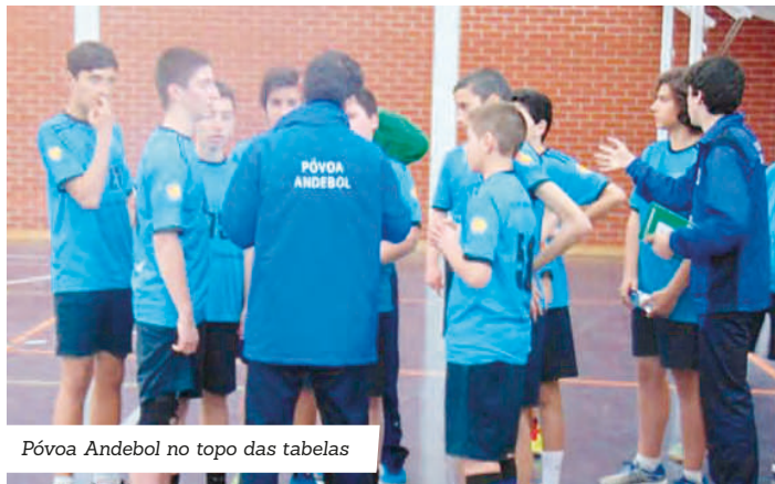
Póvoa Andebol no topo das tabelas

Quatro jogos e outras tantas vitórias foi o resultado de um fim de semana de jogos do Póvoa Andebol que colocou minis, iniciados, juvenis e seniores no topo da classificação. Os infantis venceram o Colégio dos Carvalhos por 27-21, "num passo importante rumo ao apuramento para o Encontro Nacional", considerou o clube.