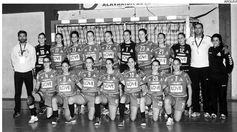
O Alavarium quer “puxar dos galões” em Gaia para garantir a presença na final