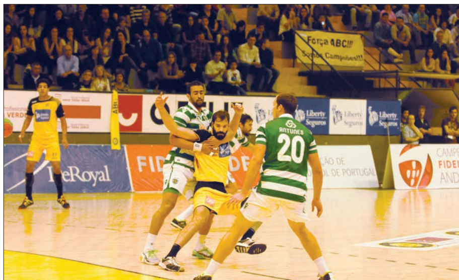
ABC volta hoje a medir forças com o Sporting

ABC/UMinho joga hoje, às 18h00, no pavilhão do Casal Vistoso, em Lisboa, o segundo jogo da meia-final do campeonato nacional de andebol da I Divisão frente ao Sporting.