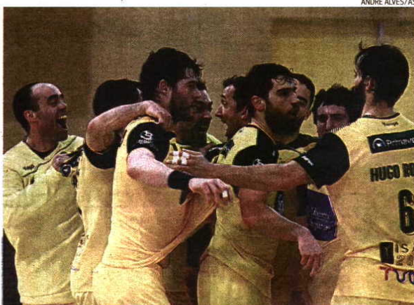
ABC celebra a vitória com a qual igualou a eliminatória, depois de ter perdido em casa