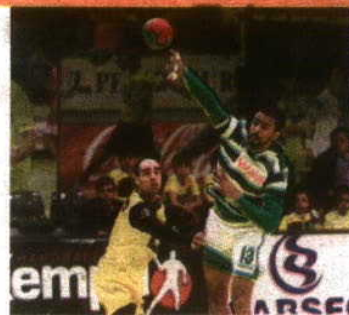
Leões ganharam o primeiro 'embate'

Lisboa recebe, hoje, o jogo 2 do duelo entre ABC e Sporting, depois do eletrizante 31-32 em Braga, que colocou a equipa leonina em vantagem nas meias-finais do play-off do Andebol 1. Os leões têm agora oportunidade de se colocar muito perto da final, mas para isso têm de ganhar em casa ao ABC. Por seu lado, os comandados de Carlos Resende sabem igualmente que uma vitória lhes devolve o fator casa, além de empatarem a série! Uma curiosidade: nos 2 jogos realizados esta época há um sucesso para cada lado. Porém, nenhum deles foi assinado no Casal Vistoso. Começaram melhor os bracarenses ao