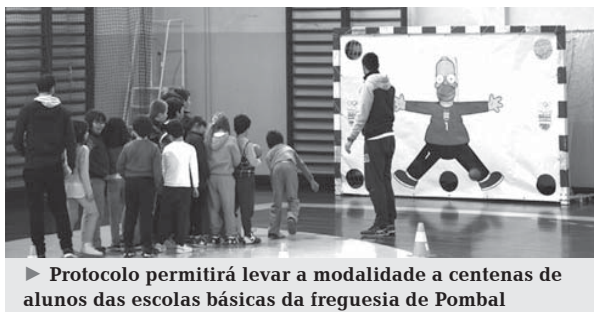
► Protocolo permitirá levar a modalidade a centenas de alunos das escolas básicas da freguesia de Pombal

Os agrupamentos de escolas de Pombal, a Câmara Municipal, a Federação de Andebol de Portugal, a Associação de Andebol de Leiria e o Núcleo do Desporto Amador de Pombal formalizaram o Protocolo Andebol 4 Kids, que pretende desenvolver a modalidade no concelho.