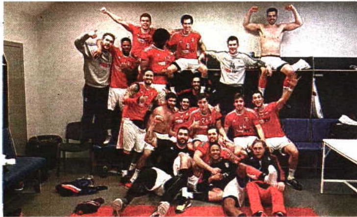
Benfica festejou nos balneários da equipa russa