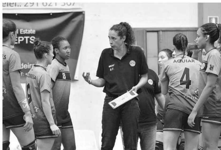
Madeirenses defrontam hoje o Colégio João Barros para a Taça de Portugal.

Na II Divisão, 22.ª jornada da fase regular, zona Norte, o Marítimo joga hoje pelas 17 horas em casa da Académica de São Mamede. Os nortenhos seguem na terceira posição com 54 pontos. Os madeirenses são sextos classificados com 44 pontos.