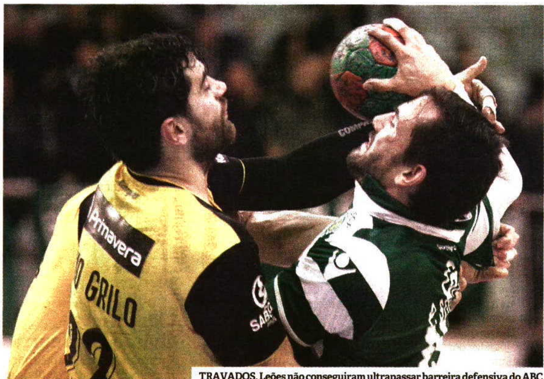
TRAVADOS. Leões não conseguiram ultrapassar barreira defensiva do ABC