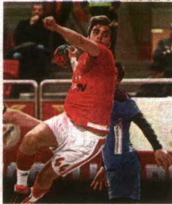
Encarnados prometem lutar pelo triunfo