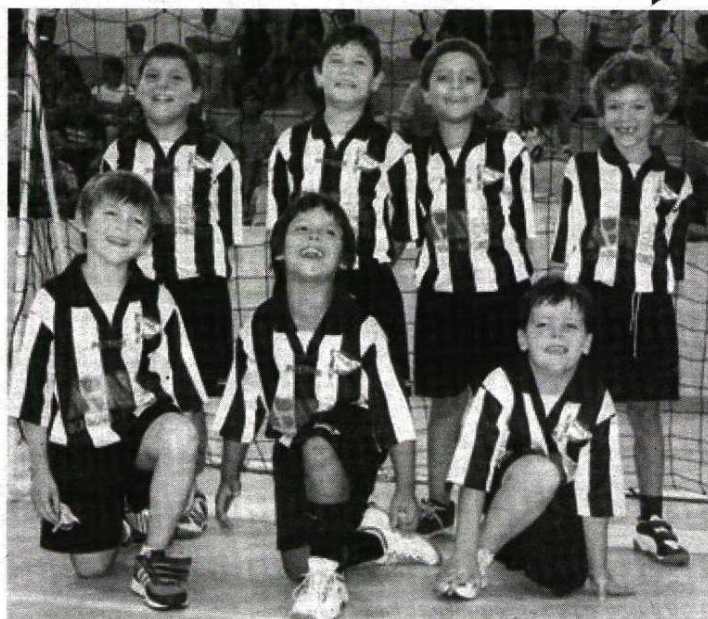
Bambis e minis