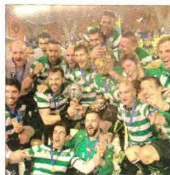
Festa leonina na Roménia

A Taça Challenge é a terceira prova na hierarquia da EHF (Federação Europeia de Andebol), depois da Liga dos Campeões e da Taça EHF. ●