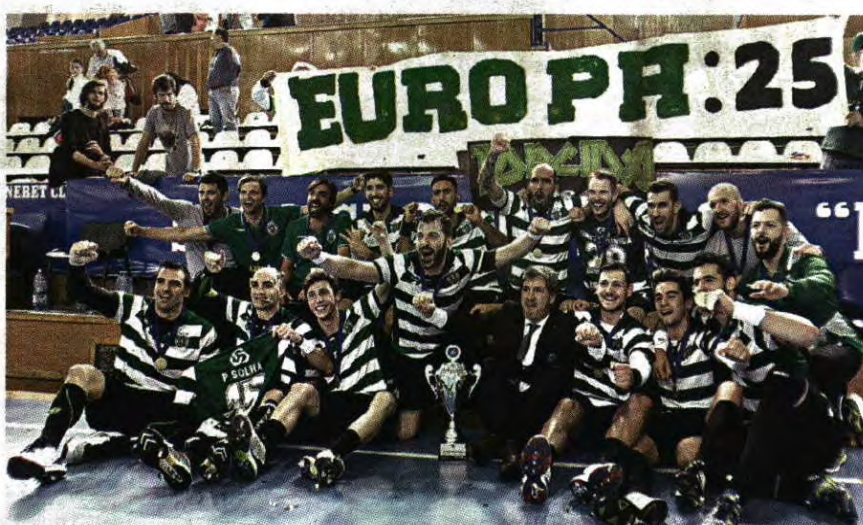
HISTÓRICO. Presidente festejou com a equipa a conquista do 25.º troféu europeu do Sporting

nove golos (37-28) de vantagem da 1ª mão e o estatuto de cabeça-de-série, confirmou o seu favoritismo, perante uma equipa resignada, cansada e com muitas lesões, depois de na última quarta-feira ter perdido (22-24) na recepção ao CMS Bucareste e falhado (1-2) o apuramento para a final do playoff da liga romena.