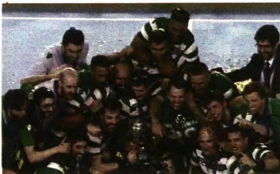
Sporting voltou a ganhar a Taça Challenge, sete anos depois