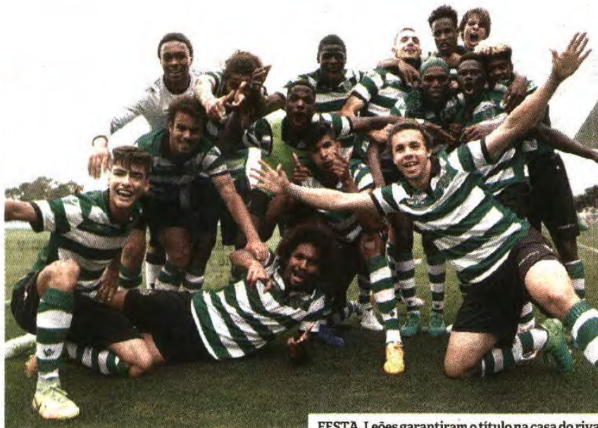
FESTA. Leões garantiram o título na casa do rival

A precisar apenas de um ponto para se tornar virtual campeão, o Sporting entrou forte no encontro frente ao