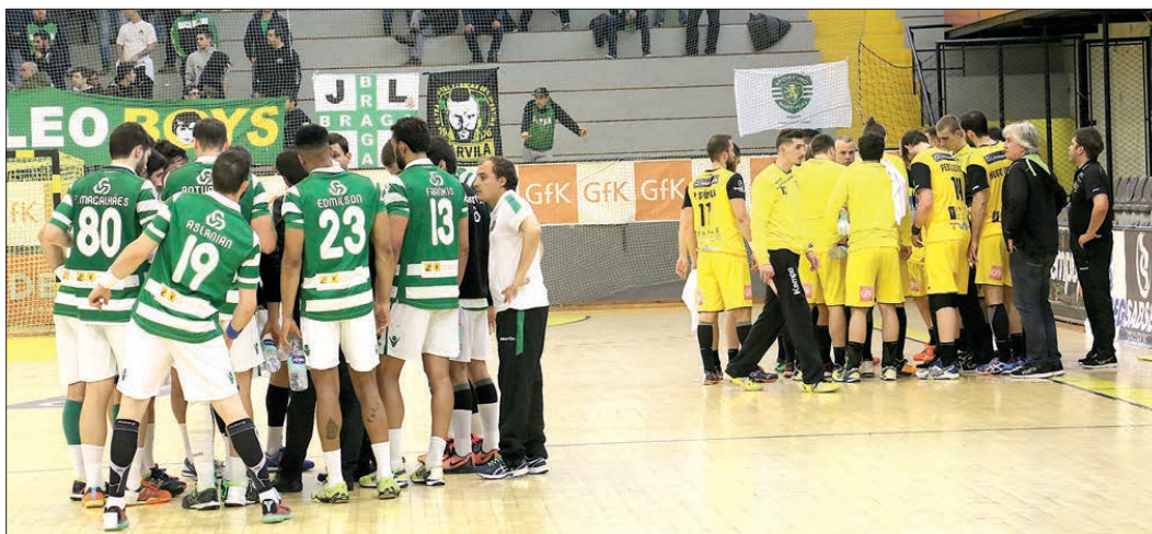
ABC e Sporting decidem eliminatória no Sá Leite

Á ganhas tu.... lá ganho eu, e assim vai a eliminatória entre o ABC e o Sporting, nas meias-finais do campeonato de andebol.