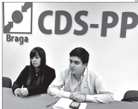
JP quer maior visibilidade a modalidades desportivas