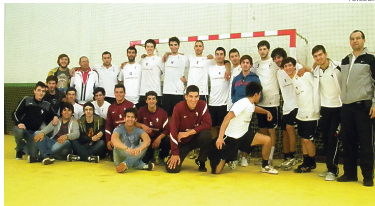
Equipa de Juniores da Associação Artística de Avanca