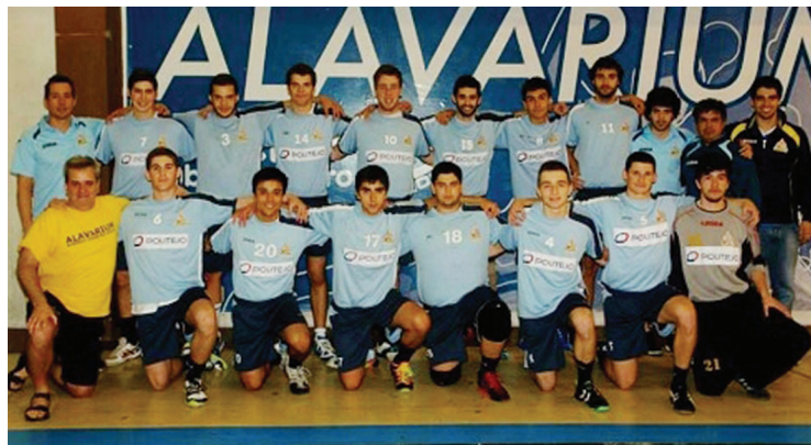
Equipa de Juniores do Alavarium - Andebol Clube de Aveiro

Decisão Alavarium ou Artística de Avanca? Um deles será campeão nacional da 2.ª Divisão da categoria e juntará o ceptro à subida de divisão já garantida pelas duas equipas da região