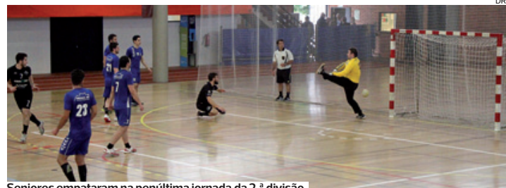
Seniores empataram na penúltima jornada da 2.ª divisão

Os veteranos formaram duas equipas de ex-atletas, que se defrontaram entre si, num "aquecimento" para o jantar. O resultado