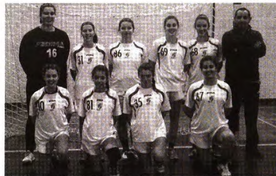
Juvenis Femininos do Cister SA venceram o Batalha AC

No Campeonato Nacional de Iniciados Masculinos, zona 5,e em partidas da 7ª jornada, o Externato Dom Fuas Roupinho foi vencer fora o NDA Pombal, (18-26), enquanto o Cister SA perdeu fora de casa com o SIR 1º Maio, (42-29). Na ronda 6 a AEDF Roupinho foi derrotada pelo SIR 1º Maio, (30-34), enquanto o Cister SA perdeu em casa com a AC Sismaria, (15-41). ■ JJP