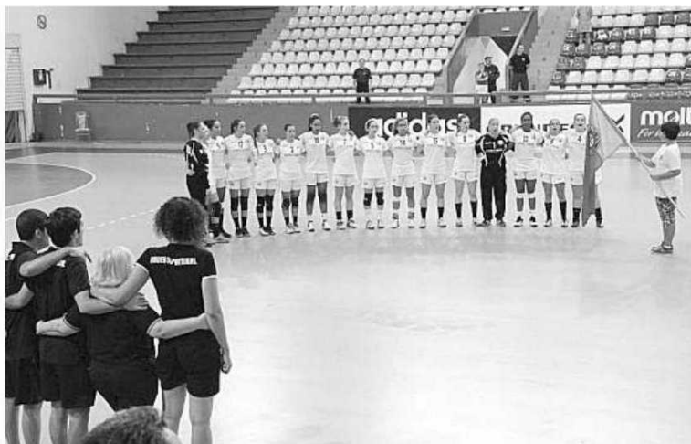
A selecção portuguesa contou com cinco atletas madeirenses.