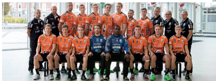
Campeões suecos são os “cabeças de cartaz” do Torneio Internacional de Avanca