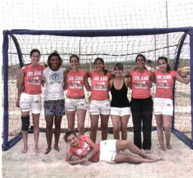
Lois/Autoliz foi uma das equipas vencedoras do torneio

Cinco mais um e BRR11/Kempa on line, em rookies masculinos e femininos, respectivamente, fizeram a festa final na sua categoria,