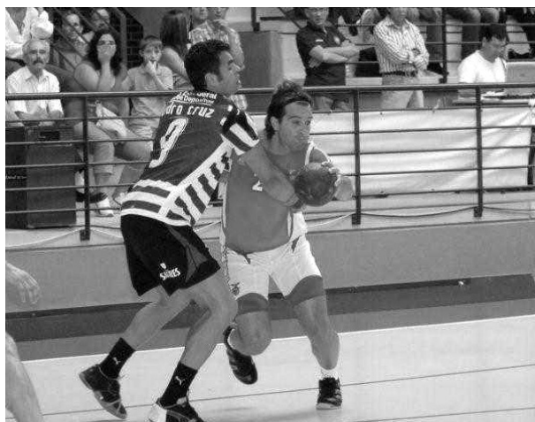
O Benfica começa a preparação da época com um estágio em Vouzela

Entretanto, no dia 10, a partir das 18h00, inicia-se o treino no Pavilhão Gimnodesportivo de Vouzela, uma sessão que será