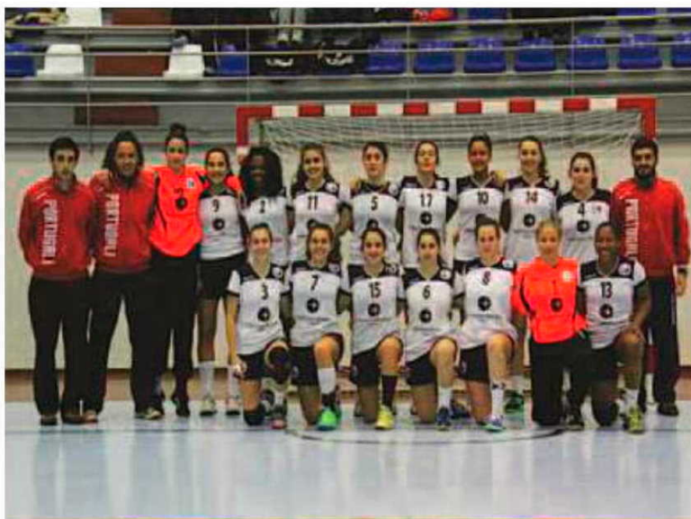
Seleção portuguesa contou com quatro atletas do CS Madeira.