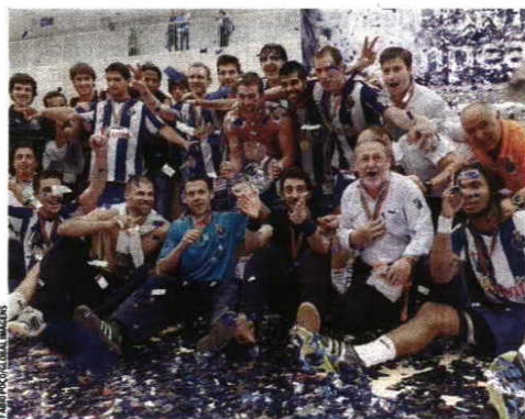
Final de play-off FC Porto campeão em 2008/09

CAMPEONATO NACIONAL DA I DIVISÃO Modelo competitivo do torneio vai ser alterado na próxima época, sendo a segunda fase jogada em eliminatórias