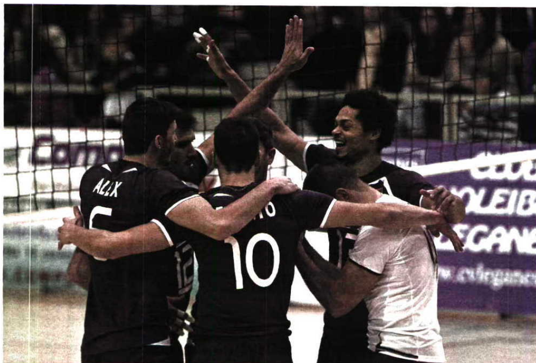
Portugal venceu dois jogos particulares com a Espanha na preparação para esta fase

Portugal vai lutar pela terceira presença em fase finais de um Mundial. Foi 15.º em 1956 e oitavo em 2002