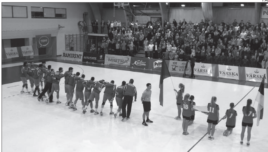
A seleção portuguesa no início do jogo da Estónia

A próxima jornada é já no domingo, com Portu-