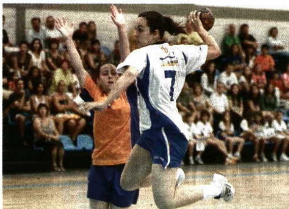
Mortíferas As campeãs nacionais seguem na Europa

No outro jogo da Taça EHF, o João de Barros perdeu, em França, a primeira mão (21-24) frente ao HAC Handball, com a segunda partida a ter lugar já hoje. M.R.