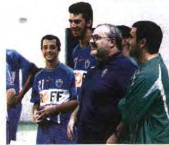
Lisboetas têm feito época surpreendente

Apesar dos seis primeiros classificados estarem fora de campo — competições europeias —, o Andebol 1 promete muita animação nos quatro jogos que hoje encerram a 12. a jornada. A começar pela visita do Boa-Hora ao sempre complicado recinto do Horta. Os lisboetas são uma das sensações do Nacional da I divisão e ocupam o 7. o lugar. Mas são seguidos de perto pelo Águas Santas, que, numa visita não mais agradável a Fafe, tudo fará para colar-se aos seis primeiros, um salto que Belenenses também pretende dar em Braga. O S. Mamedé recebe o ISMAI e tanta sair do último lugar que ocupa sem qualquer triunfo. E. D.