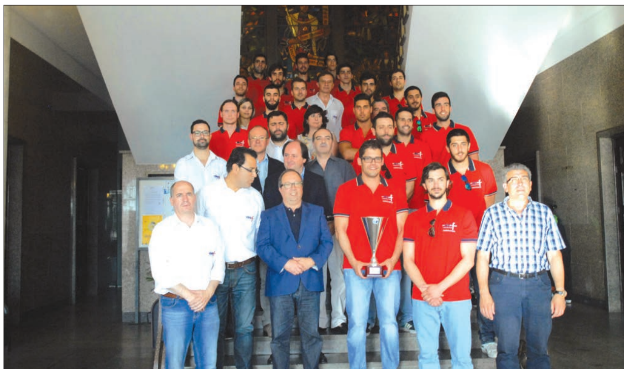
Comitiva do Andebol Clube de Fafe

A equipa sénior do Andebol Clube de Fafe foi recebida, na passada segunda-feira, na Câmara Municipal de Fafe, depois de se ter sagrado campeã nacional da Segunda Divisão de Andebol.