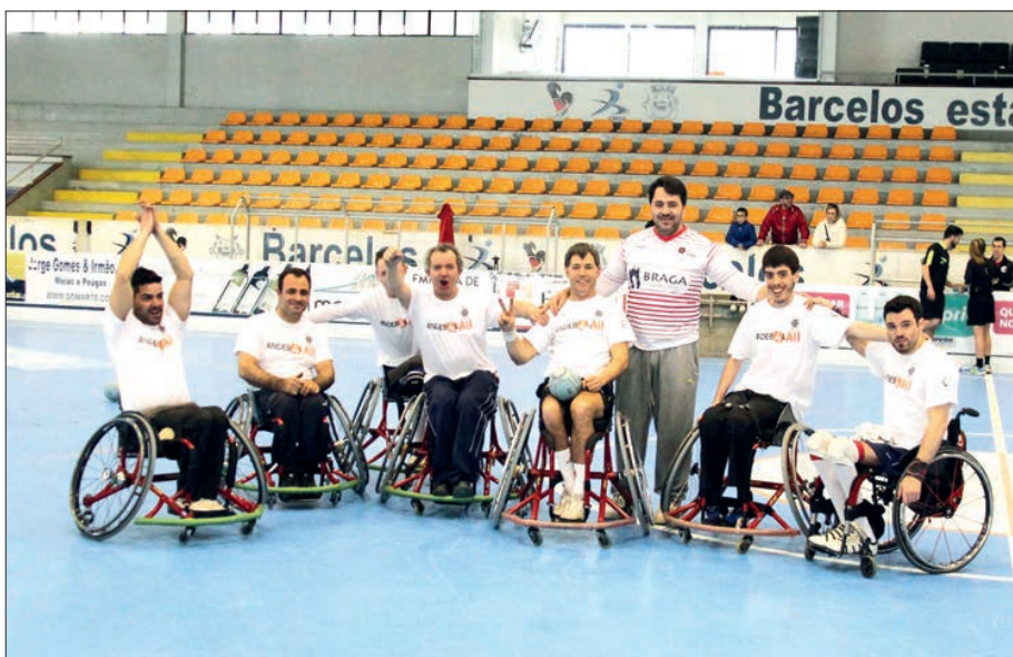
Equipa de andebol de cadeira de Rodas da APD Braga