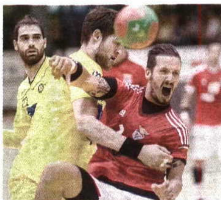
Gonçalo Delgado / Global Images