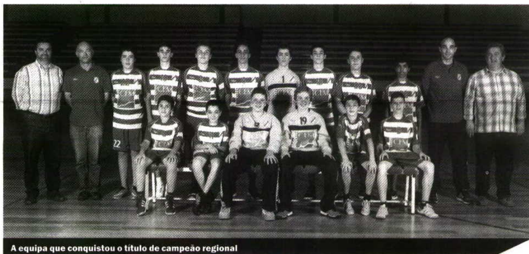
A equipa que conquistou o título de campeão regional

A equipa de Juvenis do Sporting Club da Horta disputou também no