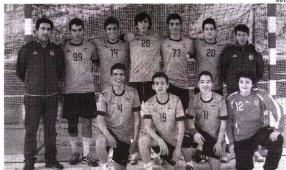
Iniciados Masculinos da AEDFR são Bicampeões do Torneio Primavera