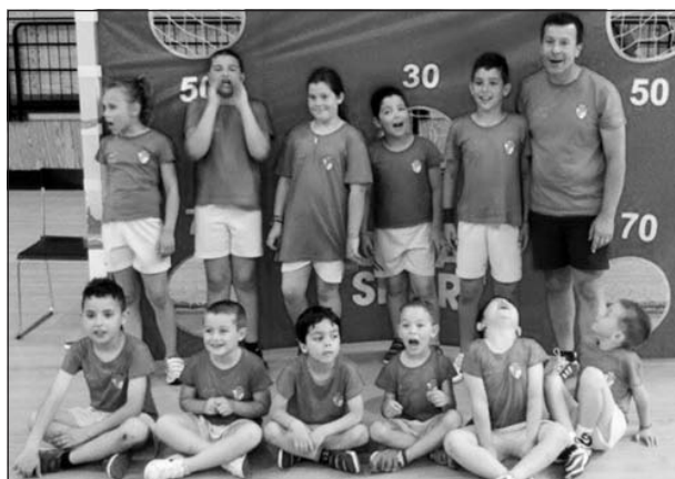
Equipa de Bambis do C.D.T.N.

Tal como previsto, realizou-se no passado domingo (dia 07Junho) no Palácio dos Desportos em Torres Novas, a última etapa do circuito regional de Bambis em andebol de 4. Estiveram presentes cinco clubes, num total de 9 equipas, tendo sido realizados 16 jogos num ambiente de muito desportivismo entre todos os atletas, dirigentes, árbitros e Pais presentes. Apesar da ausência de alguns clubes que normalmente se fizeram representar noutros encontros, a etapa de Torres Novas decorreu de forma exemplar, resultado do empenho e vontade de todos os que com a sua contribuição pessoal tornaram possível este evento. Especial agradecimento a todos os Pais, aos amigos do andebol, à Câmara Municipal de Torres Novas e ao representante da basa do Intermarché Godinho pelo apoio prestado.