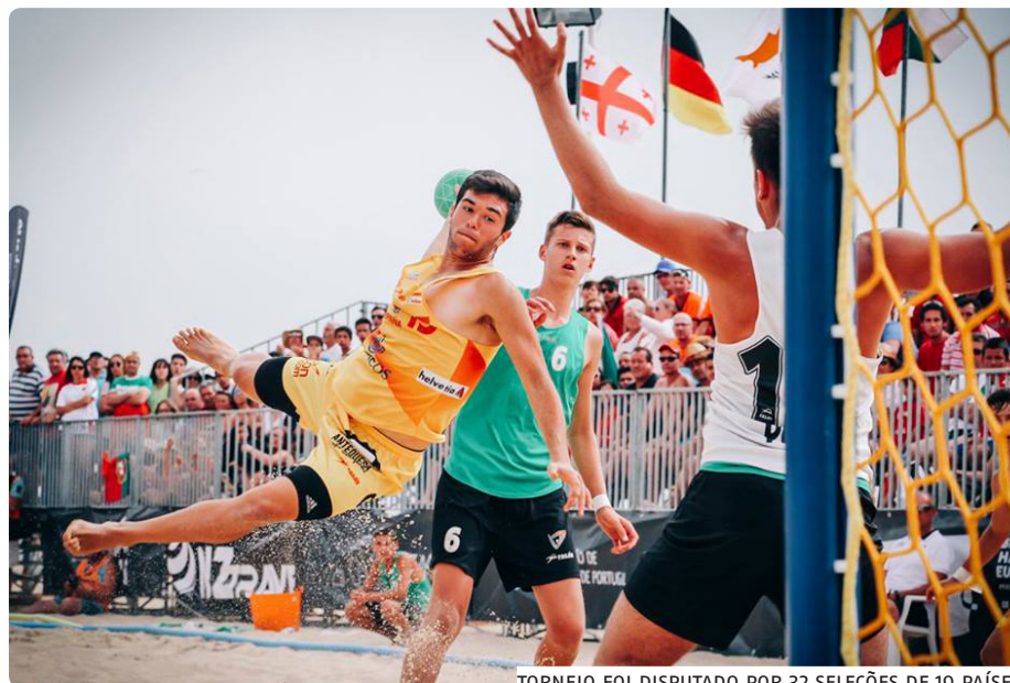
TORNEIO FOI DISPUTADO POR 32 SELEÇÕES DE 19 PAÍSES

Portugal conquistou a medalha de prata em masculinos e a de bronze em femininos no Europeu de sub-16 de andebol de praia, competição que terminou no passado domingo no areal da Nazaré.