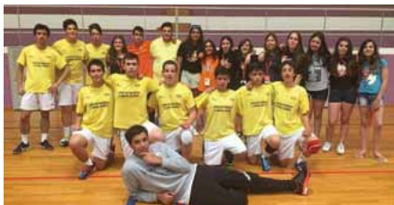
O grupo de atletas

As equipas de Iniciados masculinos e iniciados femininos da Escola de andebol da Associação de S. Miguel do Mato participaram no Torneio Garci Cup entre os dias 29 de junho e 3 de julho de 2016. Este torneio contou com 300 equipas e 3500 atletas.