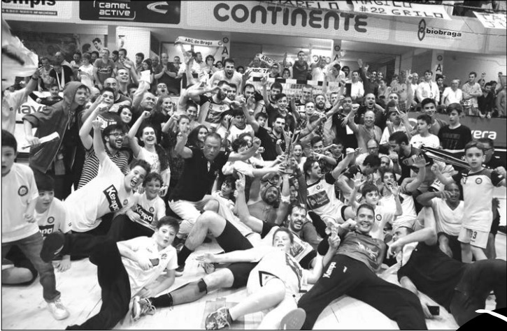
Campeão ABC e estreante Arsenal da Devesa começam campeonato em casa