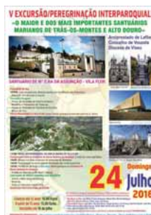
O cartaz das festividades religiosas

Depois do passado dia 03 de Julho, as comunidades paroquiais são convocados mais uma vez a integrarem e peregrinação desta feita rumando à "...única cidade portuguesa baptizada pelo rei... Vila Flor". Será o próximo domingo, 24 de Julho, com partida marcada para às 07h00 desde as localidades das paróquias de Fataunços; Figueiredo das Donas e São Miguel do Mato. O itinerário obedecerá a concentração de todos os autocarros em Moçamedes seguindo direcção para EN 16, rumando ao Nô de Bodiosa rumo à A-25 Direcção Guarda, passando por Celorico de Beira/Trancoso (Visita Panorâmica) / Vila Nova de Foz Côa (Pequeno Almoço no Parque de Merendas, seguido de uma breve visita aos monumentos de cariz cultural). Após a Travessia do Douro, chegada à Vila Flor e visita panorâmica aos lugares de interesse da sede do Concelho. A celebração eucarística está prevista para às 11h00, na Igreja Matriz de Vila Flor. Após a missa rumar-se-á para o Santuário