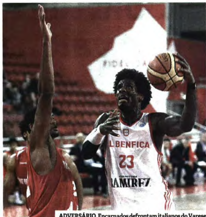
ADVERSÁRIO. Encarnados defrontam italianos do Varese