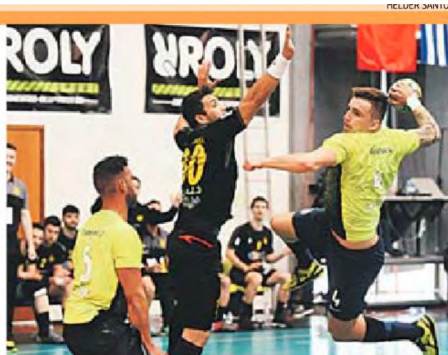
Embora a final esteja mais distante, madeirenses prometem luta na Grécia