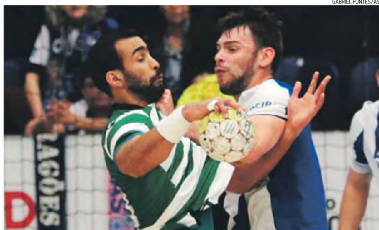
Sporting e FC Porto protagonizaram, no Dragão, o jogo grande da jornada 5 da 2.ª fase