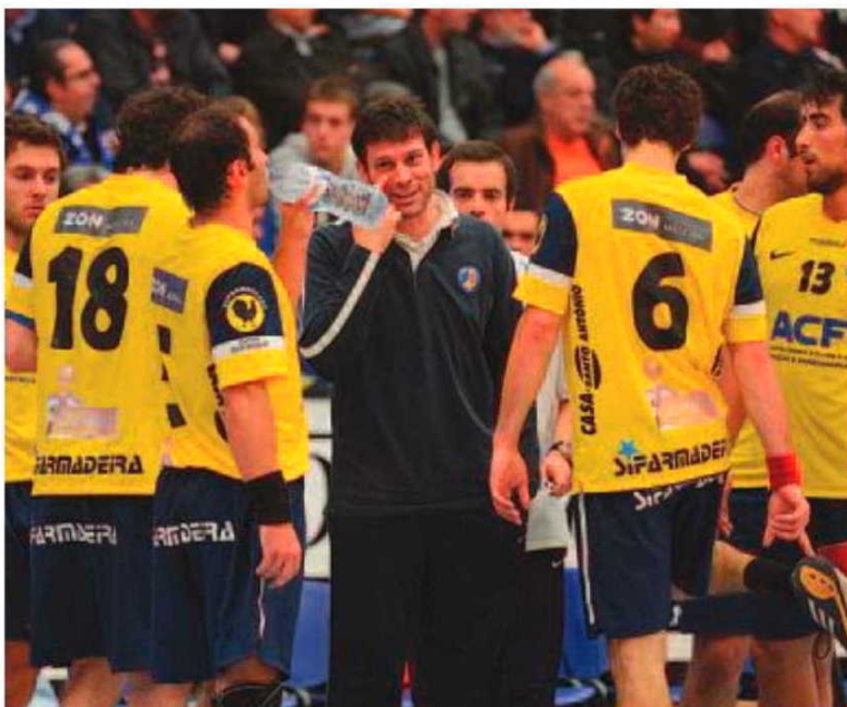
Mesmo sem dinheiro, os atletas da SAD têm sido bravos.

No campeonato nacional da I Divisão em seniores femininos, o relevo vai todo para a tarde de domingo, quando o Madeira Andebol SAD, receber às 15 horas, no