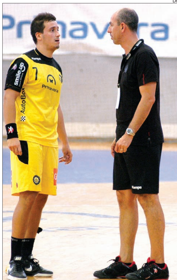
ABC acredita que pode ser o primeiro a vencer no dragão