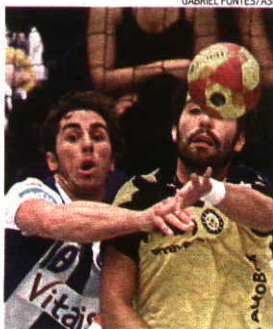
FC Porto e ABC defrontam-se esta tarde

→ Andebol 1 → 8.ª Jornada → Grupo A → Hoje