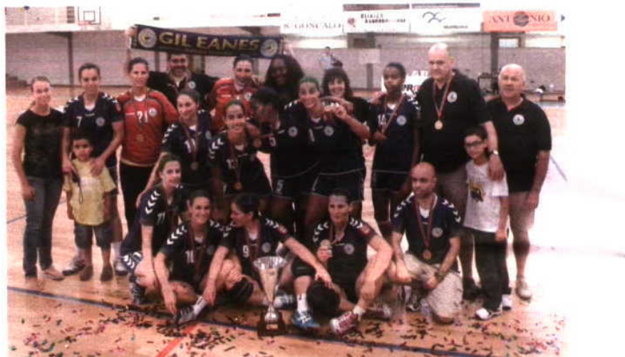
As bicampeãs nacionais já têm a sua taça e as medalhas