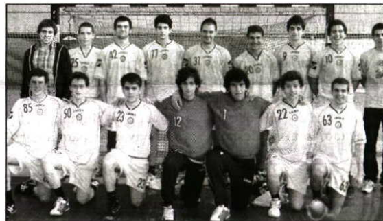
Atleta do ABC é uma referência da modalidade