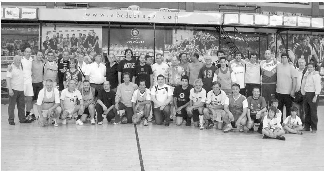
Antigos jogadores, treinadores e dirigentes do ABC de Braga e Sp. Braga reuniram-se mais uma vez para recordarem tempos de glória