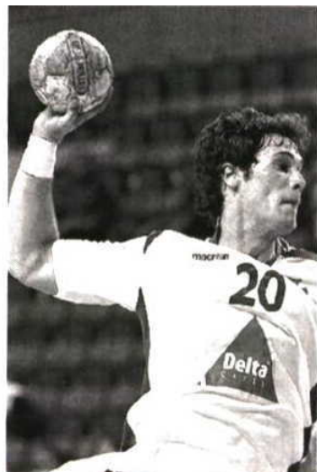
Internacional é alvo de cobiça

ANDEBOL ))) ÁGUAS NÃO EXERCEM DIREITO DE OPÇÃO SOBRE O PIVÔ DO BELENENSES