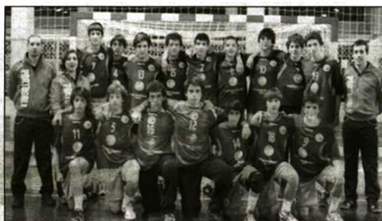
A representar Portugal na selecção nacional