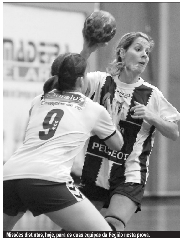
Missões distintas, hoje, para as duas equipas da Região nesta prova.