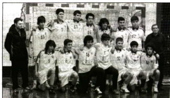
Ao serviço da selecção regional