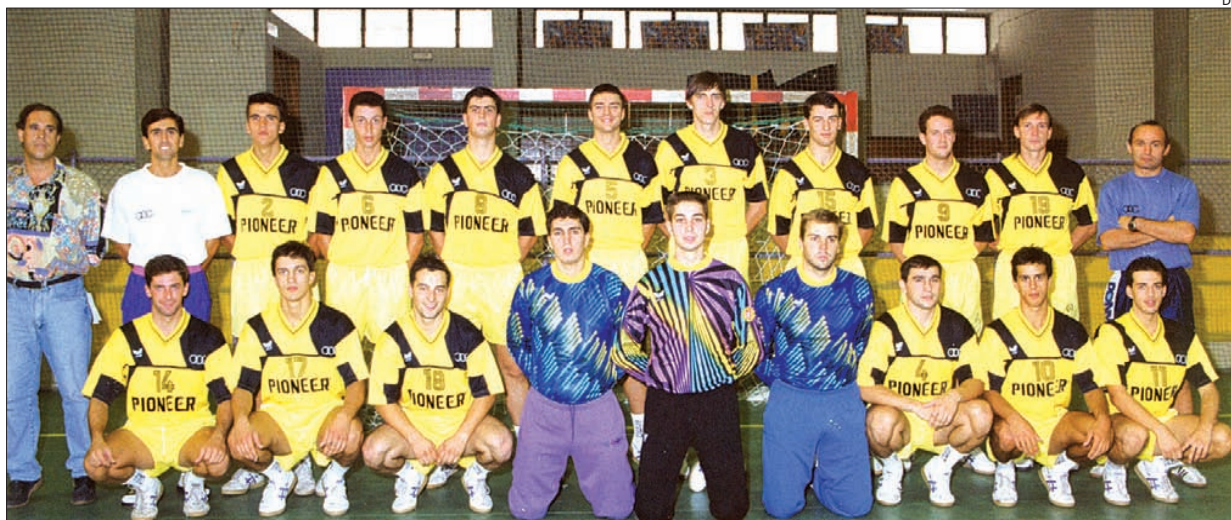
São vários os elementos desta equipa do ABC que, hoje, marcarão presença na confraternização