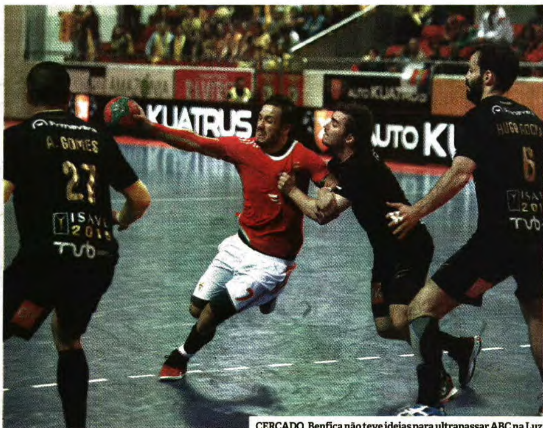
CERCADO. Benfica não teve ideias para ultrapassar ABC na Luz