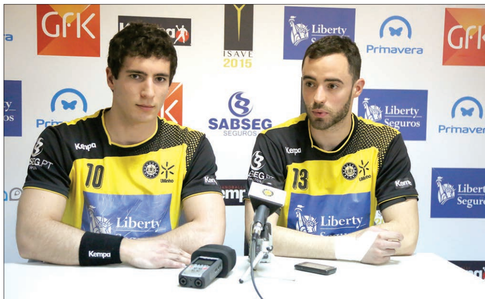
Branquinho e Sarmiento querem erguer o troféu