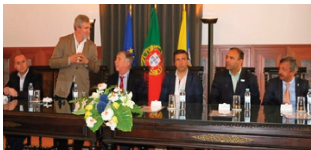
Gala foi apresentada em Pinhel