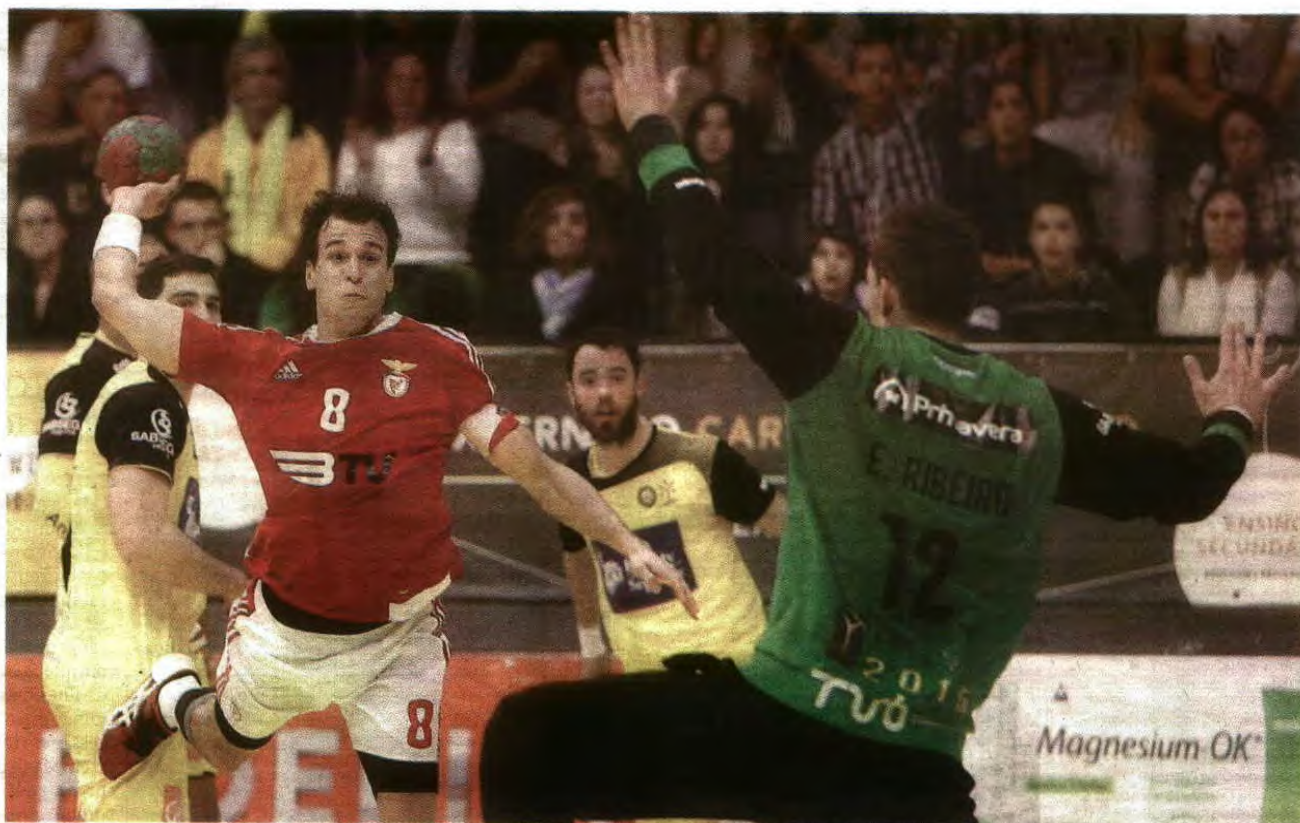
Paulo Jorge Magalhães / Global Images

Pavilhão Flávio Sá Leite vai encher para receber, a partir das 18 horas, a segunda mão da final da Taça Challenge, entre ABC e Benfica