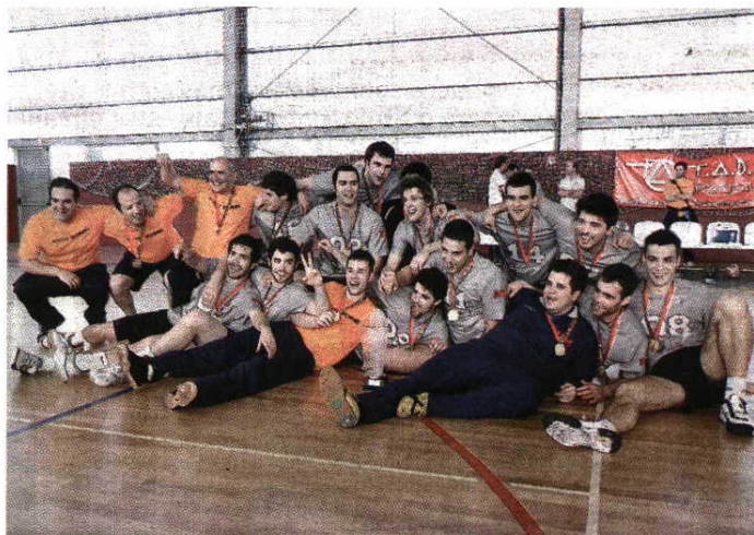
Bicampeã > Universidade do Minho fez a festa pela segunda vez consecutiva