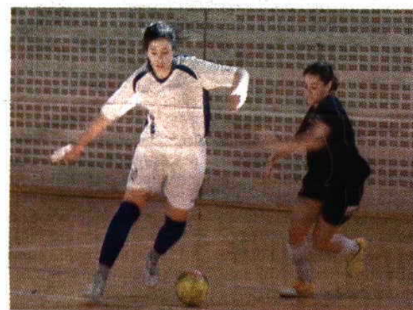
Futsal > AEISEP e AAUM querem repetir a vitória da AAC