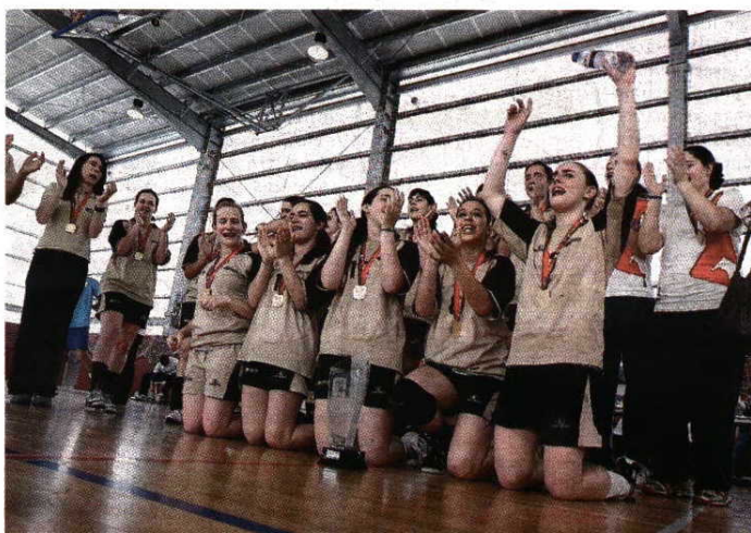
Tetracampeãs > Universidade do Porto já vai em quatro títulos seguidos