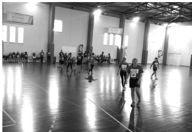
JOGOS DESPORTIVOS ESCOLARES são projeto genuinamente açoriano

Fruto desta associação, que se mantém até ao ano letivo de 2019/20, a edição deste ano tem como tema central “Desporto Escolar Açores ProSucesso”, desenvolvendo-se sob o lema “A Escola é Minha!”.