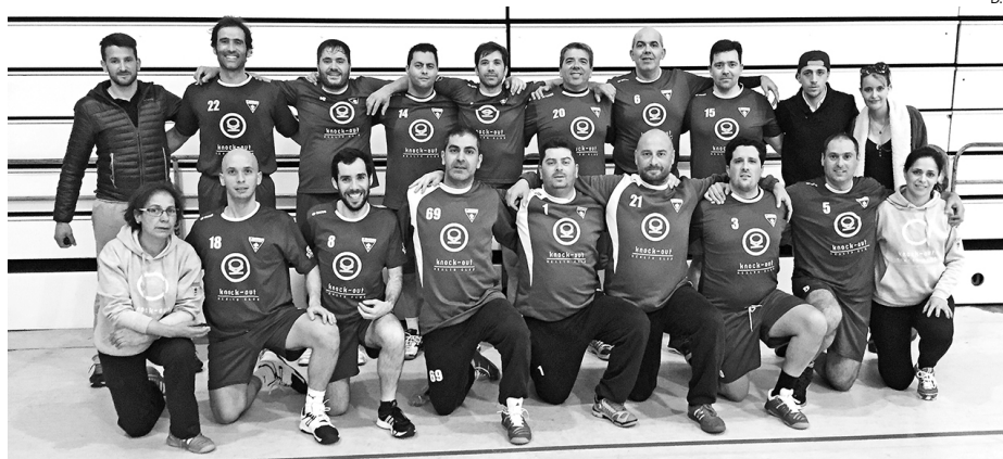
Equipa de Veteranos do São Bernardo que competiu na região da Galiza

Numa primeira fase, os oito conjuntos jogaram entre si em dois grupos de quatro. Os veteranos do São Bernardo jogaram no Grupo A e, no primeiro embate, defrontaram o Zamora, num jogo de muito equilíbrio, como de resto seriam todos, alcançando uma vitória por 18-16. Seguiu-se a partida com a equipa da casa, o Ourense, e estranhamente os aveirenses sentiram mais dificuldades do que