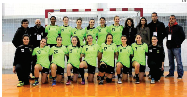
Colégio João de Barros vai lutar pelo título nacional