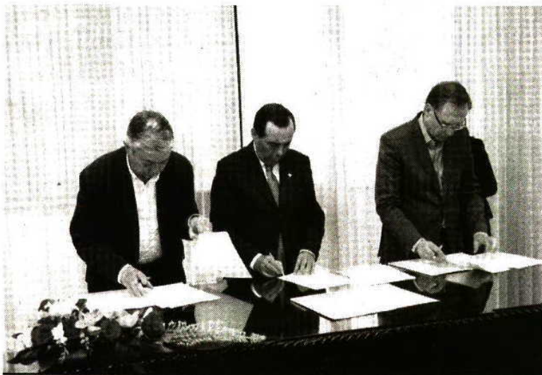
O objectivo do protocolo é dar mais visibilidade ao Andebol