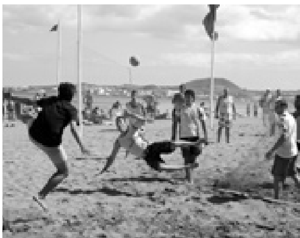
PRAIANDEBOL parte para a terceira edição em 2012