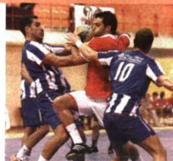
Benfica-FC Porto não está em causa