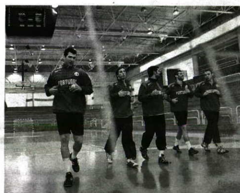
Estágio > Internacionais preparam recepção à Polónia

tem empenho e concentração para contrariar o favoritismo do adversário. Recorde-se que este grupo apura os dois primeiros classificados para a fase final do Europeu. Os 18 convocados não têm problemas físicos e ontem revelaram enorme determinação em cumprir as instruções do treinador sueco, cujos treinos, como se sabe, são exigentes. M.R.