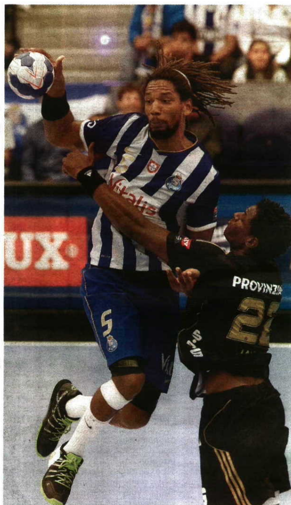
Alto nível - FC Porto vai tentar voltar a jogar a Liga dos Campeões

Se ganhar, decidirá o acesso à fase de grupos com o vencedor do jogo entre o Zaporozhye (Ucrânia) e o Junior Fasano (Itália), sendo os ucranianos claramente favoritos nesta partida