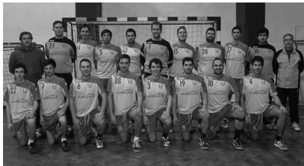
Picassinos SIR deixou o último lugar da tabela com este triunfo