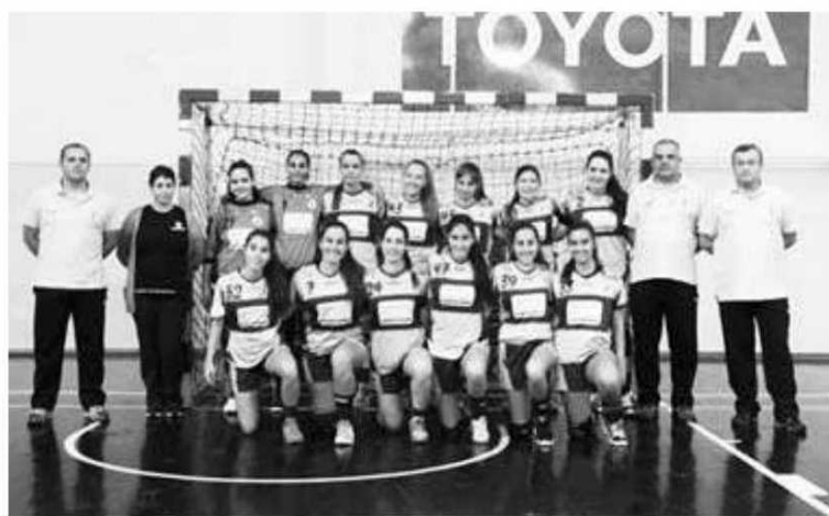
Equipa discutiu o título até final. Uma participação digna.