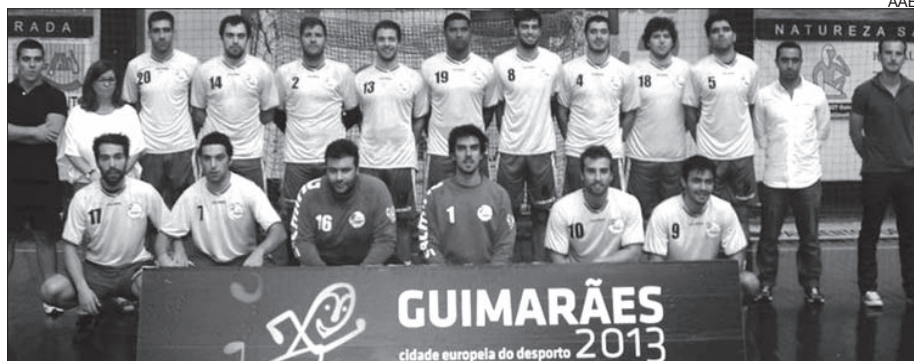
Xico regressa ao primeiro escalão e conquista título da 2.ª Divisão

A equipa de juniores do ABC terminou na segun-