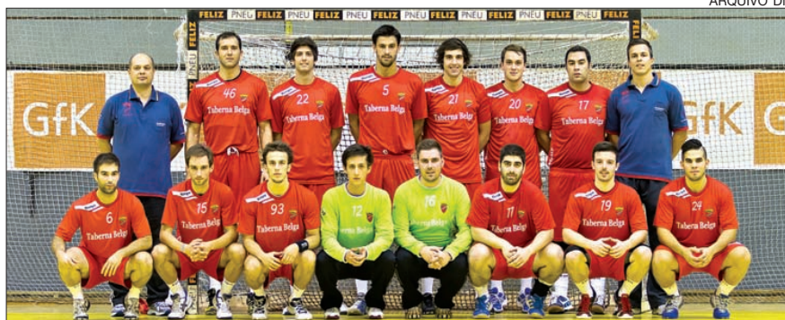
Arsenal da Devesa começa hoje a lutar pelo título de campeão nacional