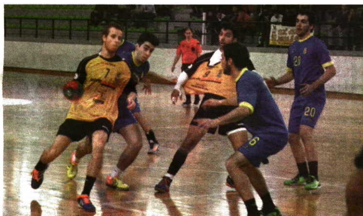
Equipa da casa CCP Serpa entrou bem no jogo e adiantou-se no marcador