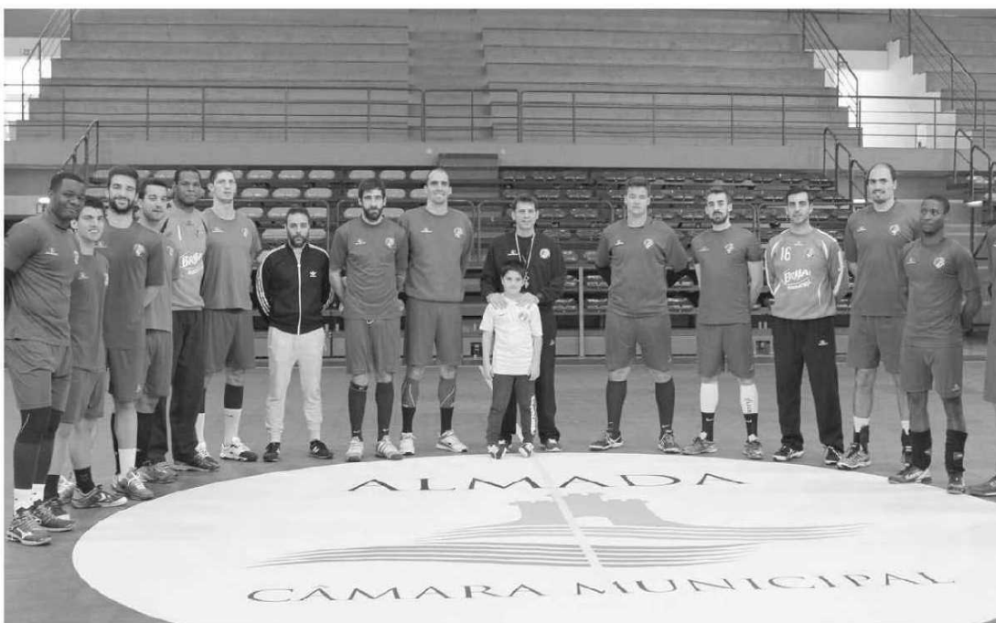
O plantel do Madeira SAD treinou ontem em Almada.