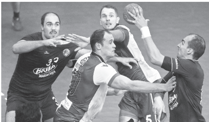
Madeirenses foram derrotados pelo Sporting.