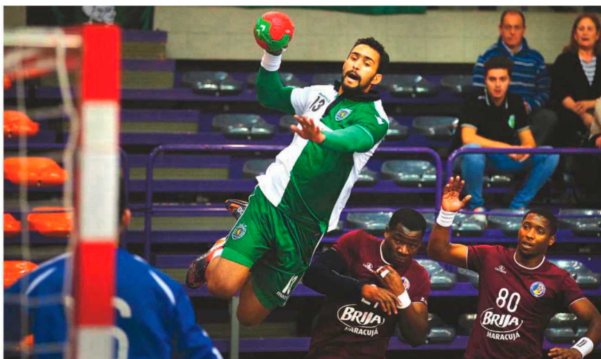
Boa réplica do Madeira Andebol durou apenas uma parte.

No segundo tempo, veio claramente ao de cima a maior capacidade do Sporting. Os madeirenses então revelam as suas fragilidades quer