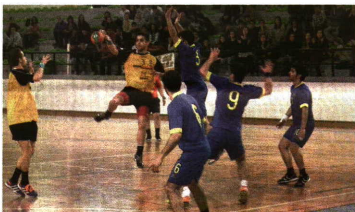
Zona Azul Boa reacção no segundo tempo permitiu virar o resultado