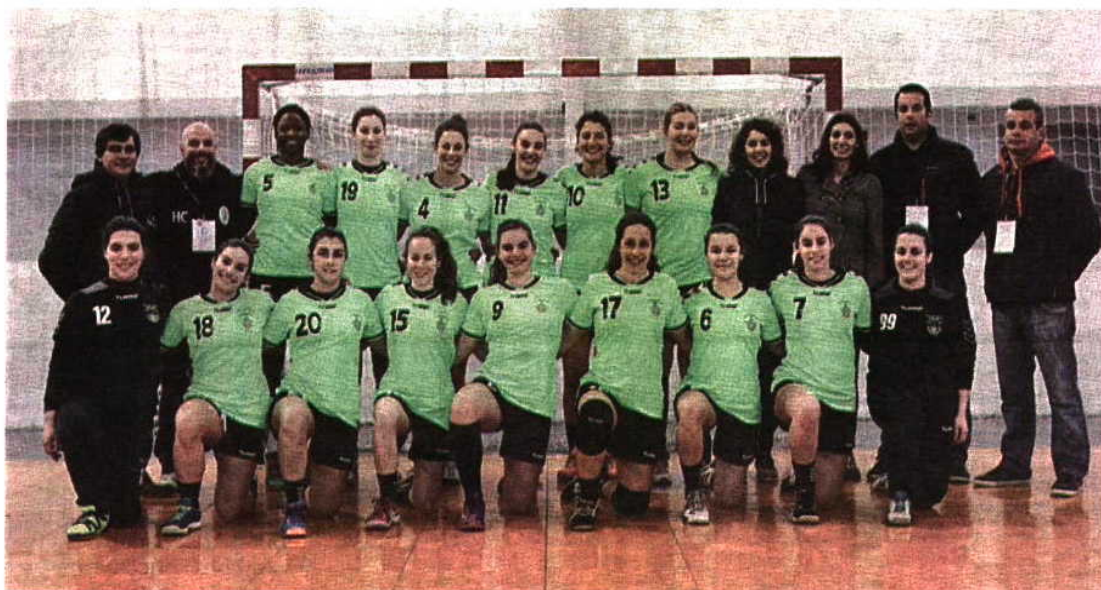
Colégio João de Barros não seguiu para a final four no confronto com o Madeira SAD, campeão em título