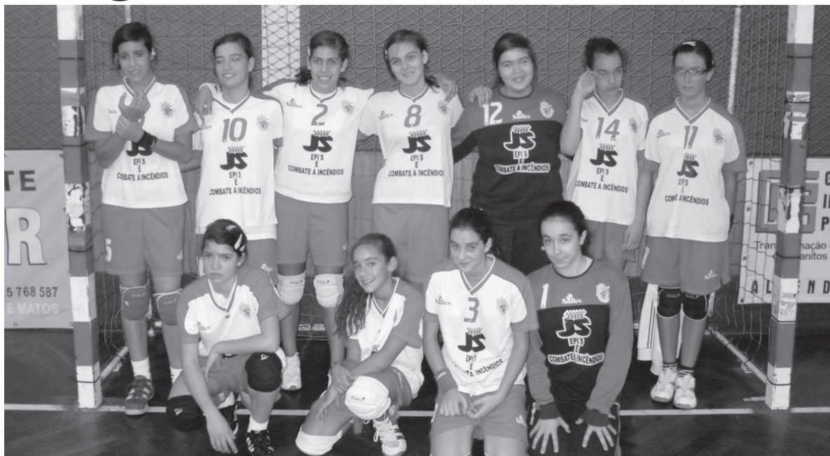
Conjunto vitorioso na 1ª divisão em Iniciadas femininas

Foi um jogo bem disputado, contando com o pavilhão municipal de Castelo Branco muito composto com muitos