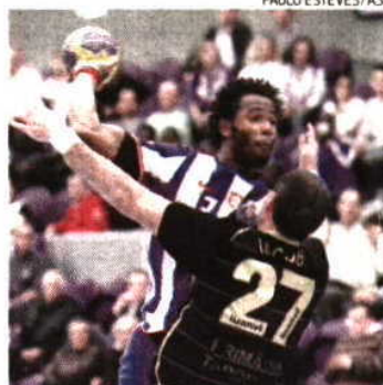
FC Porto conhece hoje rival da 3.ª ronda