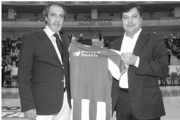
Responsável portista e o autarca mostram o equipamento do FC Porto

O documento prevê que a equipa júnior de andebol jogue, em Resende, na condição de visitado, nas instalações desportivas da autarquia. O FC Porto compromete-se a colocar o sím-