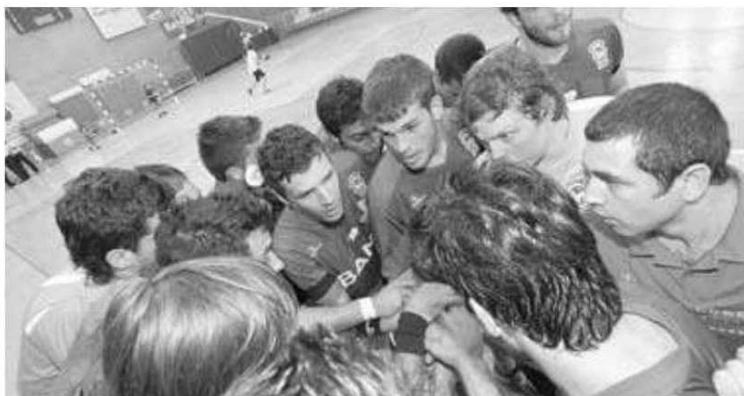
Somente os verde-rubros jogam este fim-de-semana.

mas às 15 horas, será a vez do FC Gaia medir forças com os madeirenses. Dois encontros onde os madeirenses reúnem todas as condições para ficarem com a totalidade dos pontos em disputa. O Marítimo segue na 13. a posição com 6 pontos em três jogos efectuados. O Sanjoanense soma 7 pontos e está logo acima dos madeirenses. Já o Gaia é oitavo com 8 pontos. H. D. P.