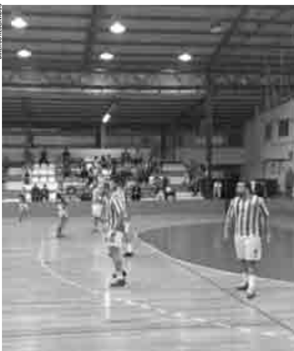
ANDEBOL. Fase do jogo disputado no Pavilhão Antoine Velge entre o V. Setúbal e o Benavente