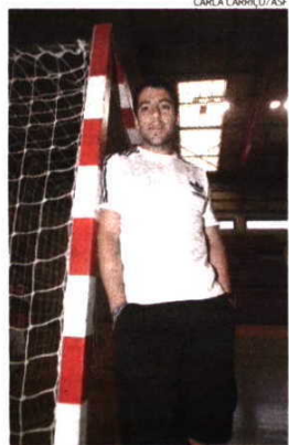
Novas responsabilidades e atitudes!

A ideia da renovação tem acompanhado a Selecção nos últimos anos, mas sem resultados. «Este discurso começou quando os atletas tinham 20 anos e ninguém aos 25 anos é um jogador feito. Mas compreendo e acho normal que as pessoas queiram mais.»