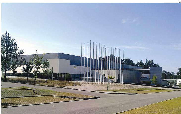
Nave Desportiva de Espinho já não vai receber jogos do Europeu Feminino

A FAP acabou por ser punida com a multa mais baixa das previstas para esta situação, que podia ascender a 500 mil euros. O impedimento, que vigorava até Dezembro de 2016, de organizar qualquer evento de selecções sobre a égide da EHF acaba por ser o aspecto mais penalizador do castigo, dado que a FAP fica impossibilitada