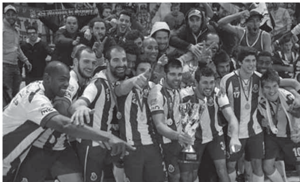
Heptacampeões nacionais de andebol jogaram dois encontros de preparação em S. Pedro do Sul

Também as selecções nacionais femininas de