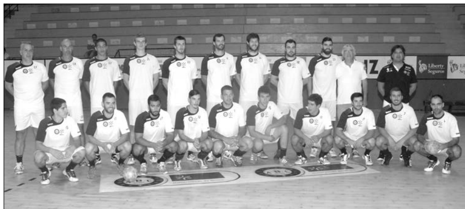
Equipa do ABC de Braga joga hoje com o vice-campeão sueco

A fechar uma semana intensa, é chegada a hora da competição oficial, com a disputa da Supertaça, frente ao campeão nacional FC Porto (30 de agosto, domingo).