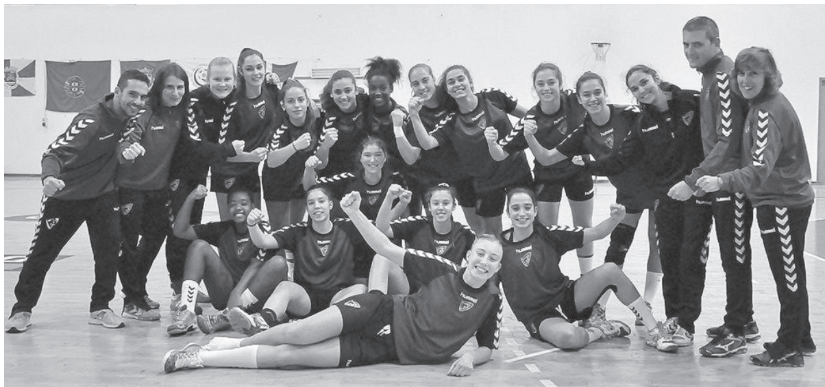
▲ A seleção nacional de sub-17