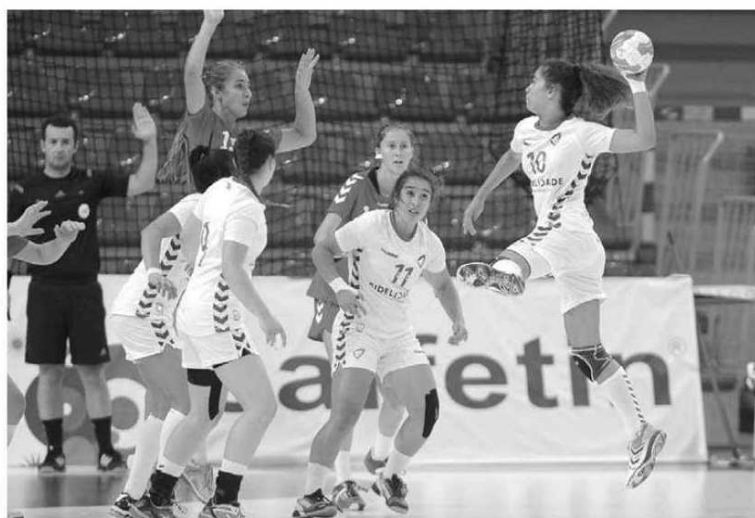
Equipa portuguesa define agora o 13.º lugar como objectivo.

Ao sexto jogo Portugal conseguiu a primeira vitória na competição que junta as melhores selecções da Europa. Na primeira fase, recorde-se, a selecção nacional foi derrotada por França (24-35), Holanda (32-20) e Croácia (28-27). Já na fase seguinte, Portugal foi derrotado por Eslováquia (27-24) e Noruega (25-24). A selecção nacional despede-se hoje da competição com os olhos no 13.º lugar.