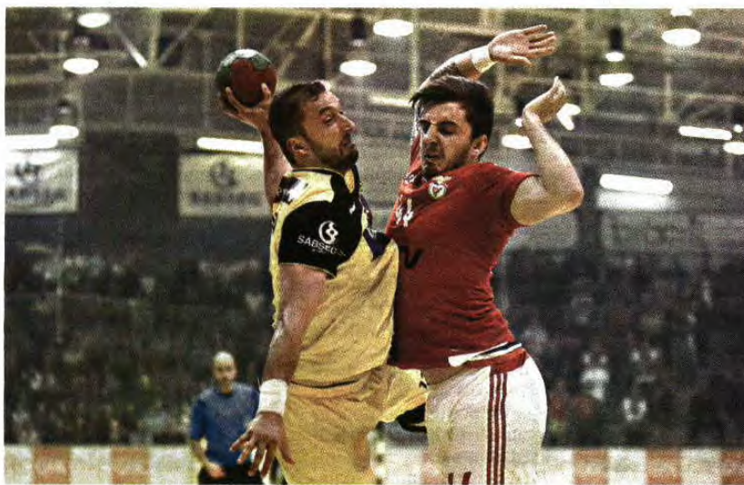
O título devia ter sido entregue na quarta-feira, mas apenas logo à tarde as equipas se defrontam

Andebol ABC não se sagra campeão nacional há nove épocas, Benfica há oito: hoje, um deles vai acabar com o jejum. Polémica dos bilhetes é garantia de finalíssima quentinha