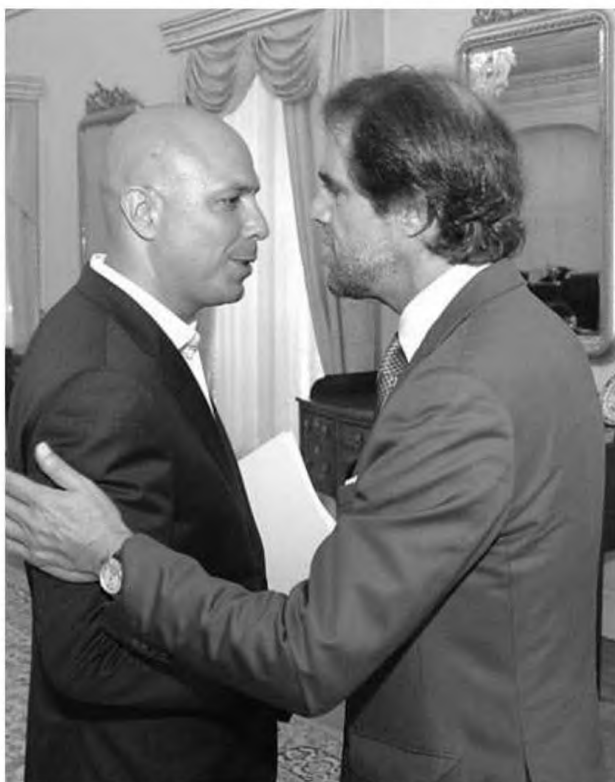
Presidente da CMF diz que não foi informado do início das obras.

Na reunião de ontem, a Câmara Municipal do Funchal aprovou a assinatura de um acordo com