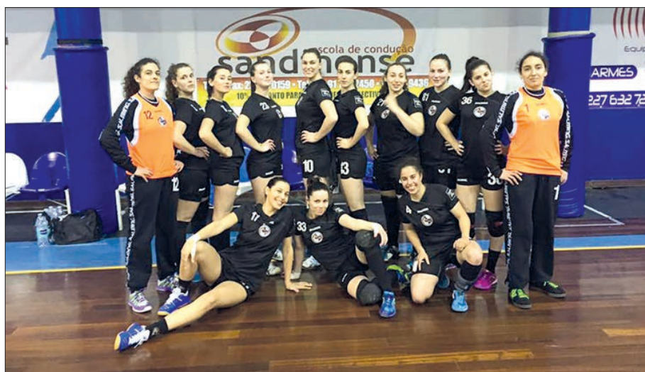
JuvMar (Esposende) tem, amanhã, um jogo decisivo no seu pavilhão

Este jogo referente à penúltima jornada do campeonato nacional da 2.ª divisão reveste-se de capital importância para a equipa da JuvMar, já que em caso de vitória,