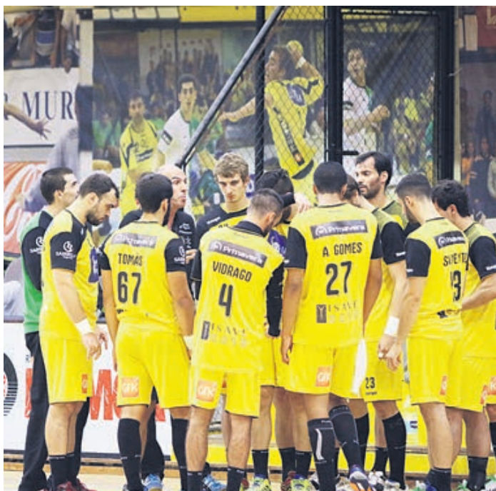
Equipa do ABC/UMinho prepara-se para o jogo decisivo de atribuição do título

Em comunicado, a Federação qualifica mesmo o jogo como de “risco elevado”, destacando que após reunião com os responsáveis pela organização da partida, foram tomadas todas as diligências necessárias “em articulação e sob coordenação das forças policiais competentes”, para garantir a segurança e normalidade dos acontecimentos nas imediações e dentro do pavilhão relativamente às “distribuição de bi-