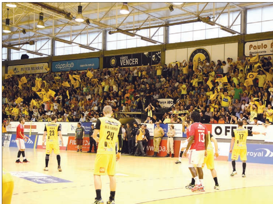
Pavilhão Flávio Sá Leite "esgotado" para o jogo do título