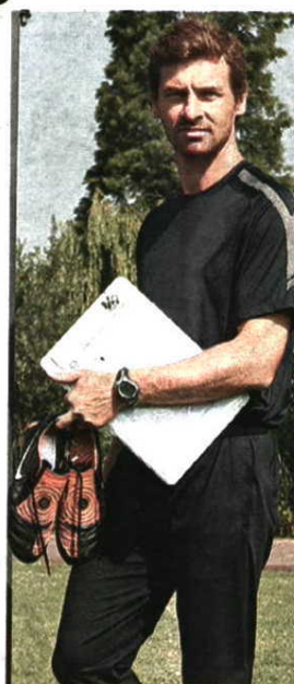
DÚVIDA. Portistas abanarão?

www.record.pt têm menos dúvidas. Passam os 60 por cento os que acham que a saída de André Villas-Boas não colocará o sucesso desportivo da equipa em causa, enquanto 37,4% defendem o oposto. A percentagem dos que não sabem ou não respondem também é menor do que a reunida entre os conselheiros de Record. Tem agora a palavra o novo técnico portista escolhido por Pinto da Costa, Vítor Pereira.