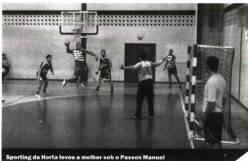
Sporting da Horta levou a melhor sob o Passos Manuel

O Sporting da Horta só volta a jogar no dia 8 de novembro, no Pavilhão Acácio Rosa, frente ao Belenenses.