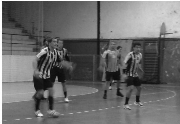
Beira-Mar defronta Monte