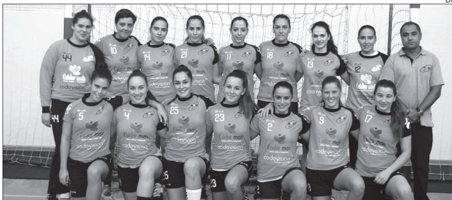
Equipa sénior feminina da Didáxis

A equipa sénior de andebol feminino da Didáxis recebeu e venceu a AA Espinho por 24-23, em encontro da segunda eliminatória da Taça de Portugal da modalidade, e continua em prova.