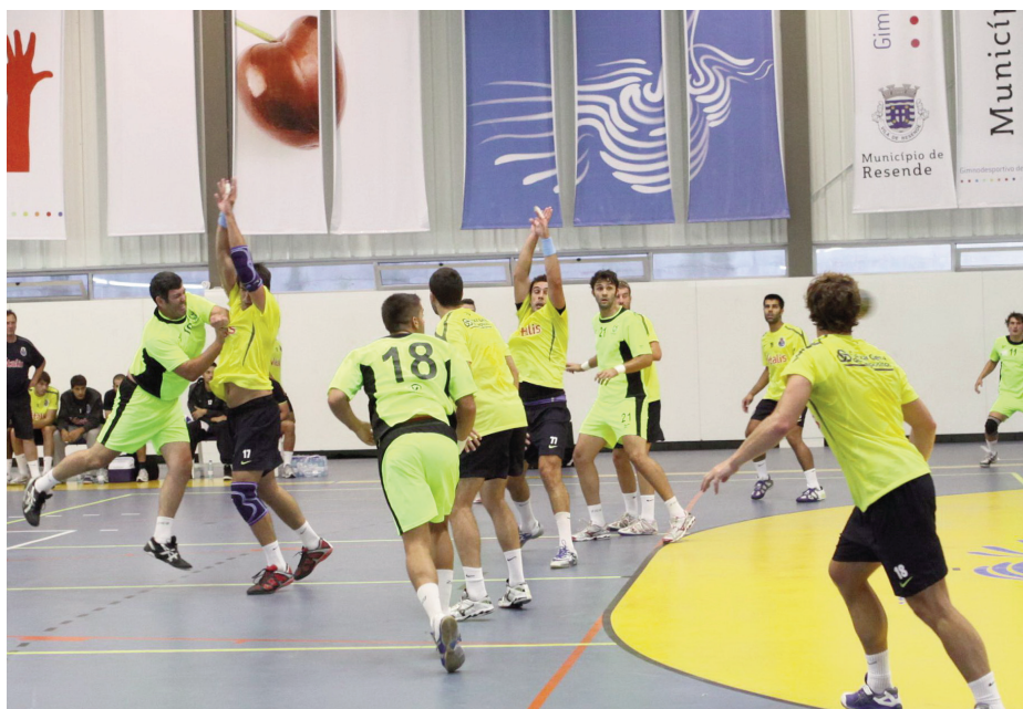
FC PORTO aproveitou estágio em Resende para realizar jogo-treino