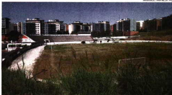
A construção do CAR do atletismo custará ao clube quatro milhões de euros