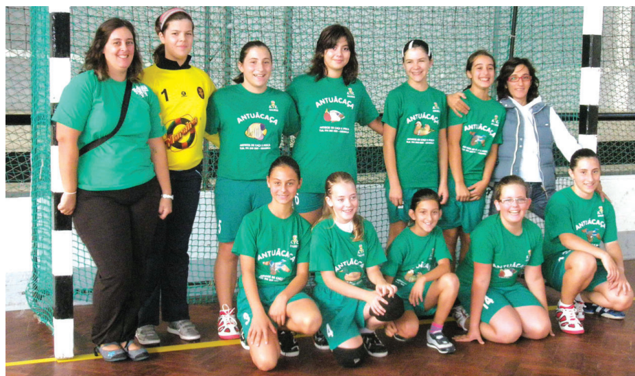
O SALREU vai, com este projecto, ganhar mais jovens para os seus escalões de formação

Captar e formar de forma conjunta atletas Bambis e Minis masculinos e femininos; aumentar o número de praticantes de andebol no concelho; cativar adolescentes para práticas saudáveis; interacção com escolas do 1.º Ciclo, envolvendo os familiares dos jovens nas actividades do clube; potenciar sinergias, competências e recursos; fomentar parcerias entre associações; dinamizar o associativismo; criar maior responsabi-