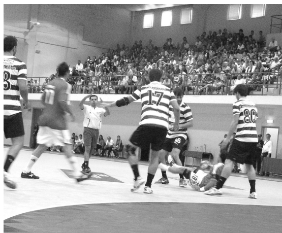
Benfica derrotou o Sporting e conseguiu o último lugar do pódio

Os 'encarnados' conseguiram dois golos de vantagem,