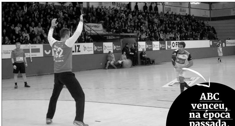
Apoio dos adeptos será fundamental para o jogo de hoje