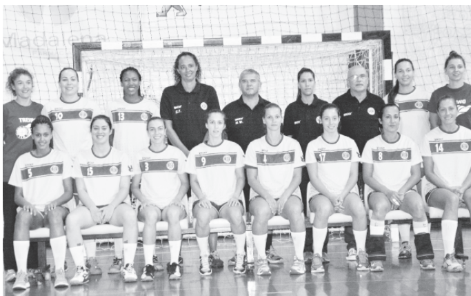
A equipa madeirense entra em campo como favorita para vencer o jogo.

A exemplo do que aconteceu no primeiro jogo, em Leça da Palmeira, onde a equipa madeirense venceu por 24-26, a partida desta noite deverá produzir um embate bem dispu-