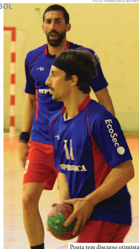
Ponta tem discurso otimista

Verdade. A quinta vitória em seis jogos esteve no bol-