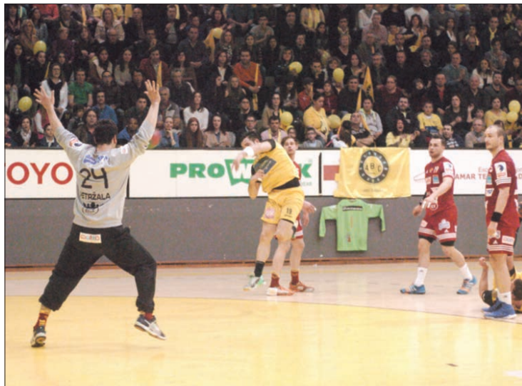
Guarda-redes dos checos esteve em destaque