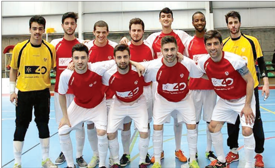
Os bicampeões nacionais de futsal