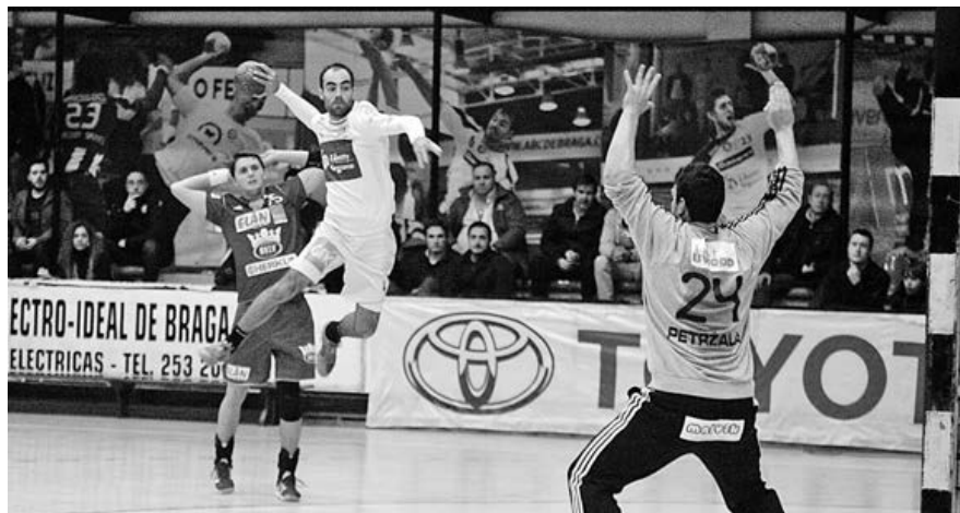
ABC/UMinho quer repetir vitórias alcançadas, na época passada, sobre o Dukla Praga e assegurar a final

Para tal, os academistas podem apoiar-se no que conseguiram fazer na edição da época passada da competição, em que venceram também os dois jogos frente à formação checa. Em casa, os bracarenses alcançaram o que desejavam, tendo conquistado um triunfo expressivo por claros 42-27. Foram 15 golos de dife-