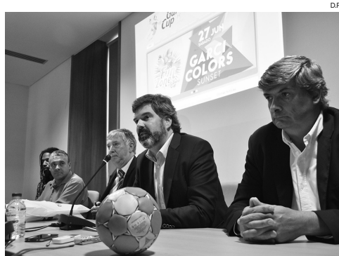
O GarciCup já foi apresentado e as expectativas são grandes

A conferência de imprensa de apresentação do torneio contou com algumas figuras importantes do andebol nacional, como por exemplo do jogador