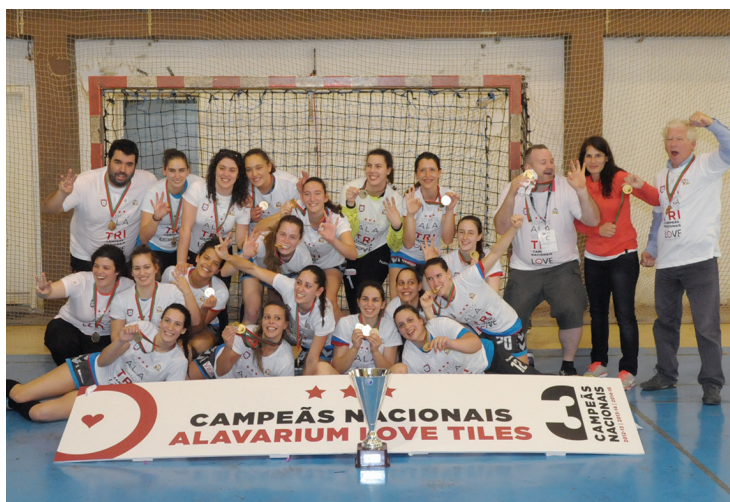
O Alavarium fez a (justa) festa do título em casa

E consegui-o. O jogo de ontem foi a prova disso mesmo.