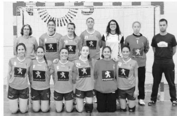
Madeirenses lutam pelo título nacional entre 12 a 14 de Junho.

Finalmente em iniciados masculinos o Madeira Andebol SAD ficou no segundo lugar e 'perdeu' o passaporte pela luta pelo título nacional, onde apenas o vencedor tinha acesso. Os madeirenses venceram o Académico FC por 34-27, mas no jogo decisivo viriam a perder diante do Colégio Carvalhos por 35-22. P. V. L.