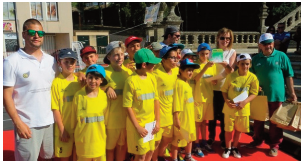
Equipa do Agrupamento de Escolas da Sé

O projecto está inserido no Plano de Desenvolvimento Regional da Federação de Andebol de Portugal e Associação de Andebol de Viseu, com vista à promoção e desenvolvimento da modalidade nas escolas do 1.º Ciclo.