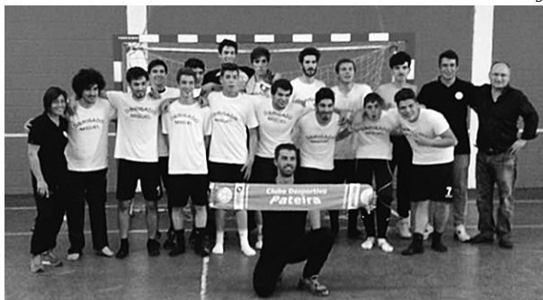
Equipa da Pateira festejou a subida à 1.ª Divisão Nacional

Assim, na próxima época, a Associação de Andebol Aveiro estará representada no primeiro escalão por três equipas: Feirense, São Bernardo e Clube Desportivo da Pateira, sendo este o primeiro emblema do concelho de Águeda a conse-