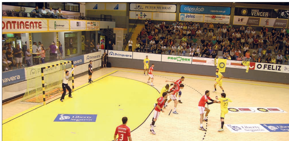
Forte apoio do público não evitou a derrota