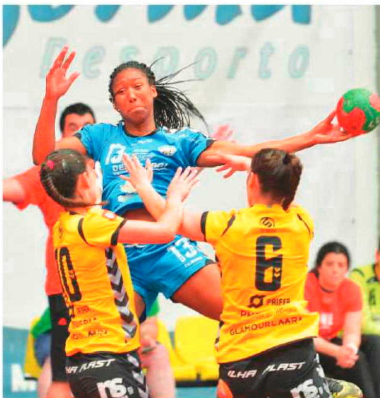
Madeira SAD foi a Aveiro ganhar o Alavarium