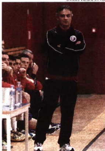
Rolando Freitas reconheceu problemas

A Seleção Nacional empatou, ontem, com Israel a 26 golos, em jogo particular que se realizou em Belgrado. A partida fazia parte do estágio que a equipa portuguesa está a realizar tendo em vista o duplo confronto com a Suíça, jogos a contar para o grupo 1 da fase de apuramento para o Europeu da Dinamarca, em 2014. Ao intervalo os pupilos de Rolando Freitas já venciam por 15-11, mas o selecionador reconheceu os problemas: «Não fizemos bom jogo. Mas isso confirma a importância de termos vindo mais cedo e prepararmo-nos num ambiente estranho, um ambiente de jogo fora de portas. Quando analisamos este jogo com Israel podemos confirmar que não há equipas fáceis na Europa. Aquilo que eu tenho vindo a dizer sobre a Suíça está refletido neste jogo — não há vitórias antecipadas. Devemos retirar as ilações, constatar o que temos de corrigir e aproveitar o tempo que nos falta para acertar esses pormenores e melhorarmos significativamente para o jogo com a Suíça», rematou o selecionador.