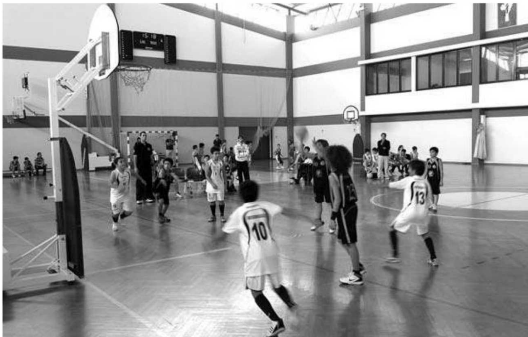
A Associação de Basquetebol da Madeira vai receber 100% do primeiro semestre de 2012.