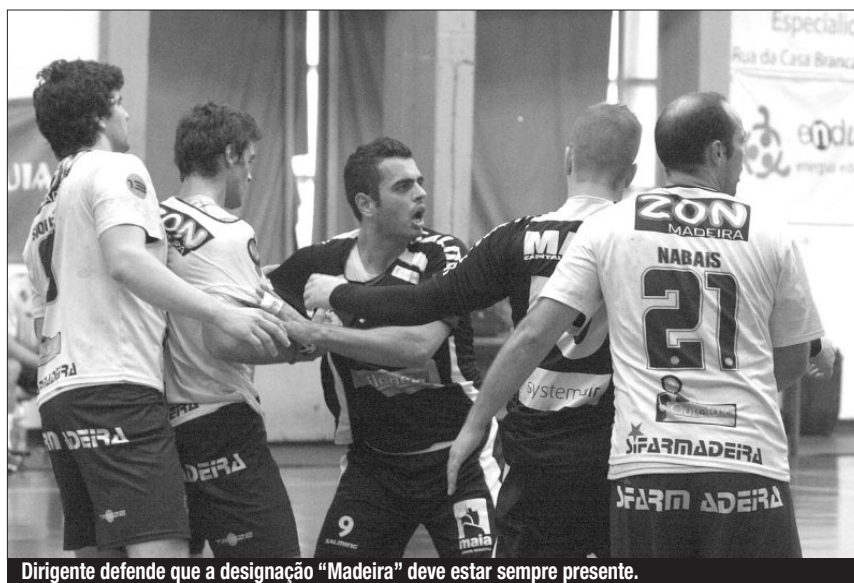
Dirigente defende que a designação "Madeira" deve estar sempre presente.

«Se existe projecto que conseguiu, de uma forma ou de outra, transmitir/divulgar o nome da Região foi através do Madeira SAD, tanto em masculinos como em femininos», diz o líder do Madeira SAD.