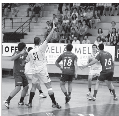
ABC alcançou o "tetra"