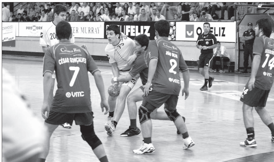
Jogadores do ABC num lance de ataque

O pavilhão, que muitos apelidam de catedral do andebol, esteve bem composto de público e, certamente, os presentes não deram por mal empregue o tempo que ali passaram. Foi um dos melhores jogos do ano da competição, que o ABC venceu, com uma fase final quase imaculada: duas vitórias (contra FC Porto e Xico Andebol) e um empate (AC Sismarias).