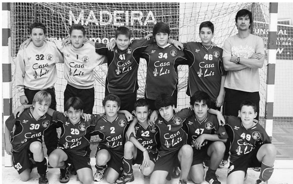
A equipa de infantis do Bartolomeu Perestrelo esteve em plano de destaque na fase nacional do seu escalão.