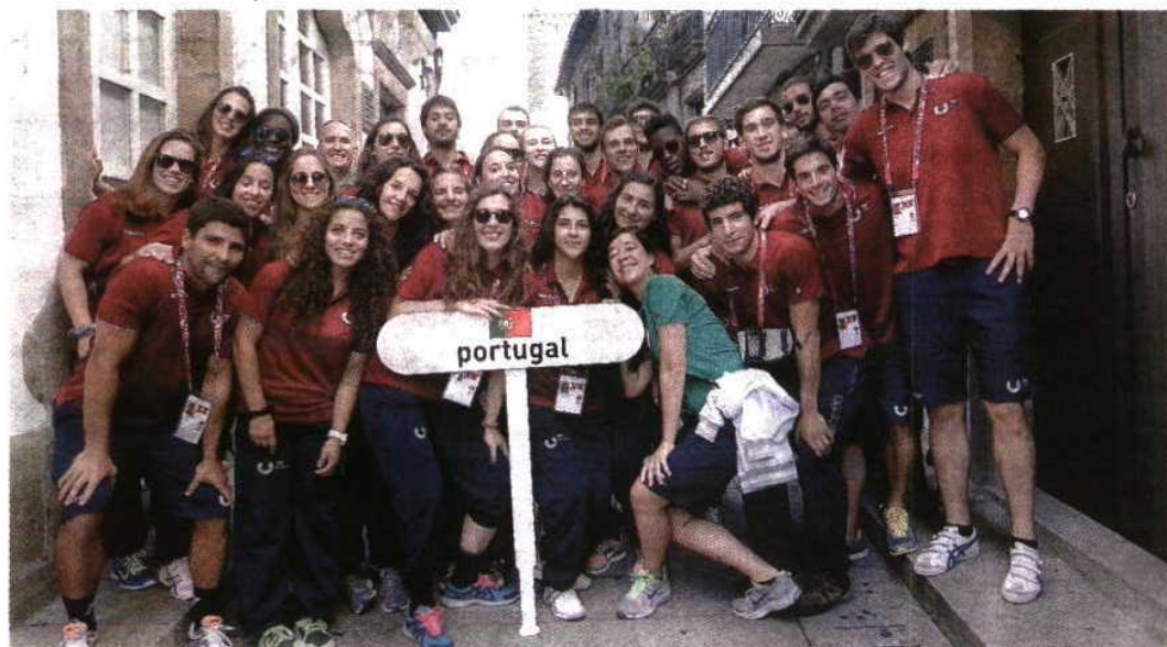
Atletas portugueses animados para este Campeonato do Mundo de andebol universitário

●●● No papel de anfitrião do Campeonato do Mundo Universitário de andebol, Portugal tem, a partir de hoje e até ao próximo domingo, uma oportunidade de ouro para festejar em Guimarães o inédito título mundial, que no passado escapou por duas vezes. Há dois anos, em Blumenau (Brasil), a Seleção foi segunda classificada, depois de ter cedido na final diante da República Checa (34-24). Mais distante é a atuação de 2000, ano no qual os portugueses, a jogar em casa (Guarda e Covilhã), também conquistaram a medalha de prata. Ontem foi dia de cerimónia de abertura e hoje a competição entre 11 equipas masculinas e 12 femininas oriundas de 15 países já é a doer. A geração de 2014 apresenta-se competitiva – o selecionador Gabriel Oliveira diz que não foi fácil escolher os 16 convocados –, juntando vários atletas que, além de estudantes, atuam em clubes da I Divisão como ABC, Águas Santas, Xico Andebol, ISMAI ou Passos Manuel. Alguns deles sagraram-se, há menos de uma semana, bicampeões europeus pela Universidade do