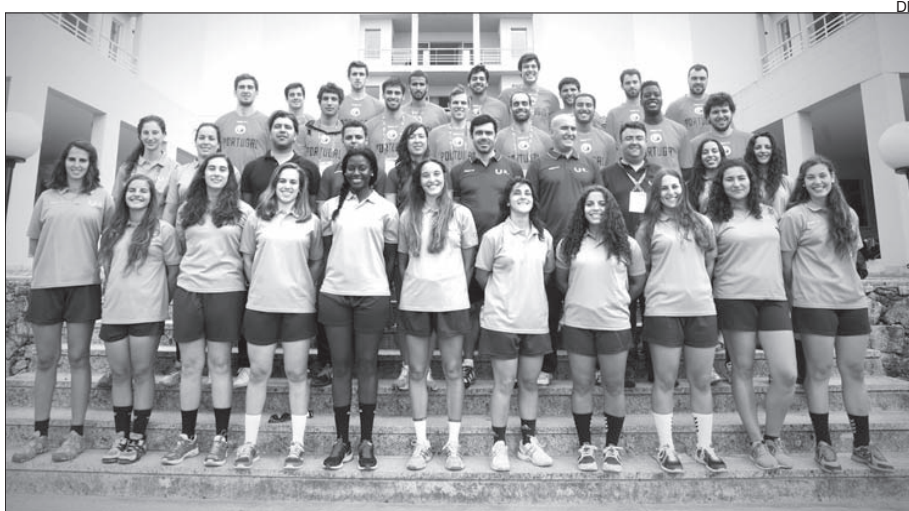
A delegação portuguesa que vai participar no Mundial Univeritário em andebol

A 22. a edição do campeonato mundial universitário em andebol arranca hoje na cidade de Guimarães, e contará com a participação de 33 equipas e cerca de 500 atletas.