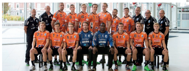
Campeões suecos são os “cabeças de cartaz” do Torneio Internacional de Avanca