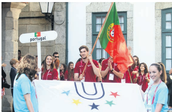
Comitiva portuguesa encerrou o desfile das comitivas participantes