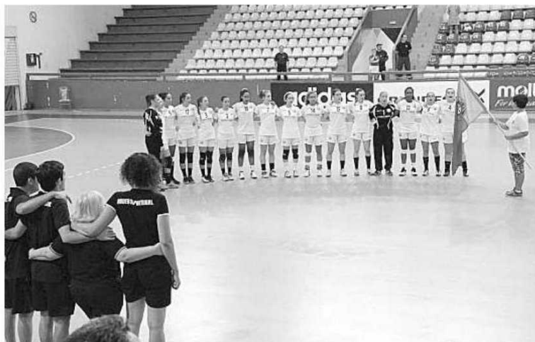
A selecção portuguesa contou com cinco atletas madeirenses.