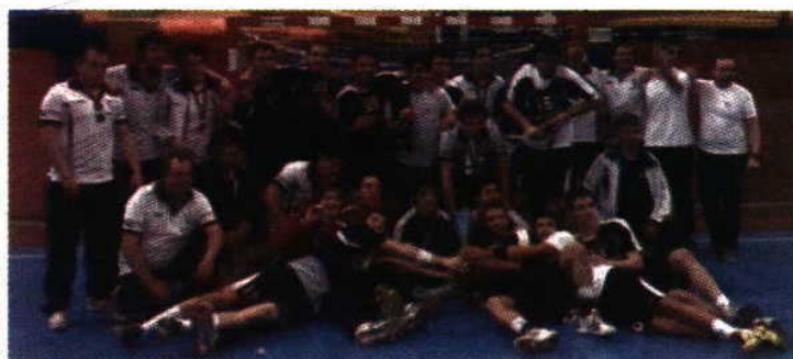
MODALIDADES // GINÁSIO DE SANTO TIRSO