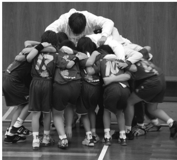
Aumentar o número de praticantes de andebol é o objectivo