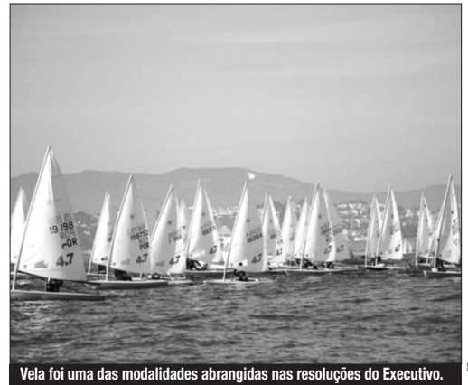
Vela foi uma das modalidades abrangidas nas resoluções do Executivo.

2008, necessárias ao normal desenvolvimento das competições a nível regional, nacional e internacional, participação de árbitros e juizes nessas mesmas competições, nos processos de preparação e competição das selecções regionais e nacionais, bem como nas actividades de formação de técnicos, dirigentes, árbitros e juizes desportivos, e demais recursos humanos relacionados com o desporto», pode ler-se no JORAM. Em causa estão as resoluções n.º 947 a 950 de 2012, sendo mandatado o secretário regional da Educação e Recursos humanos para homologar os referidos contratos-programa, que serão outorgados pelas partes. □