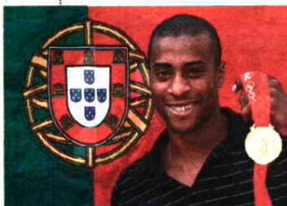
Nelson Évora de ouro