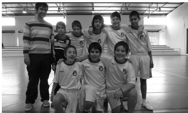
EQUIPA DE INFANTIS de S. Miguel do Mato

No sábado, os Minis deslocam-se a S. Pedro do Sul para defrontar a equipa da Associação