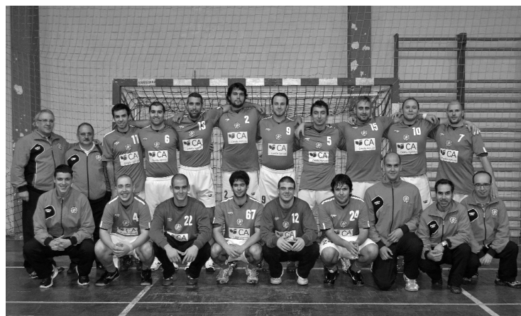
AC LAMEGO pode chegar à liderança na próxima jornada

O empate que o Andebol Clube de Lamego alcançou em Vi-