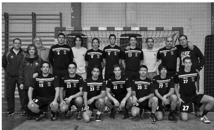
ACADÉMICO ainda não somou qualquer vitória no campeonato

O Académico de Viseu ainda não venceu no Nacional da 3.ª Divisão. Já tem três jogos disputados e conta com dois empates no Fontelo, ambos a 24 golos, e com uma derrota