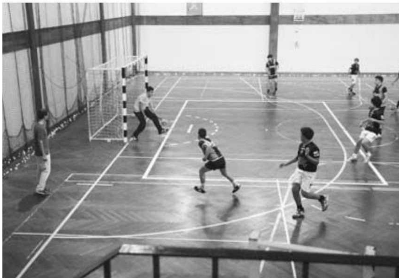
Torneio de Abertura abriu mais uma época para o andebol madeirense.

Já nos infantis masculinos as formações do Infante A e Académico somaram a segunda vitória em ou-