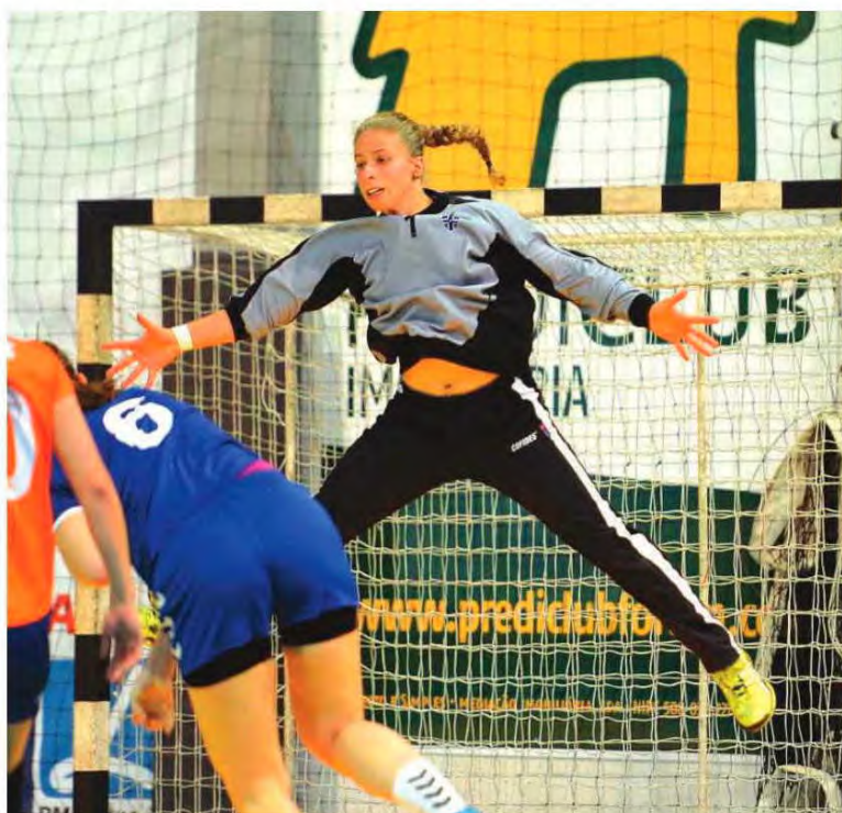
Madeirenses deram uma boa imagem.

As madeirenses não só ficaram sem o contributo desta experiente andebolista como daí para a frente perderam a concentração que até aí vinham evidenciando.