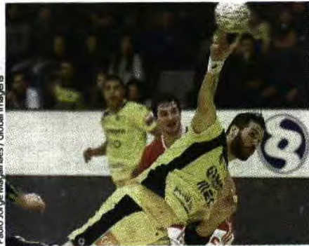
Paulo Jorge Magalhães / Global Images

José Costa vai voltar ao andebol francês