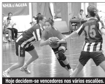
Hoje decidem-se vencedores nos vários escalões.

Ontem, terceiro dia de prova, disputaram-se na parte da manhã os jogos referentes à atribuição da classificação final dos grupos, e na parte da tarde os jogos referentes às meias-finais, onde foram apurados os finalistas quer no sector masculino como feminino.