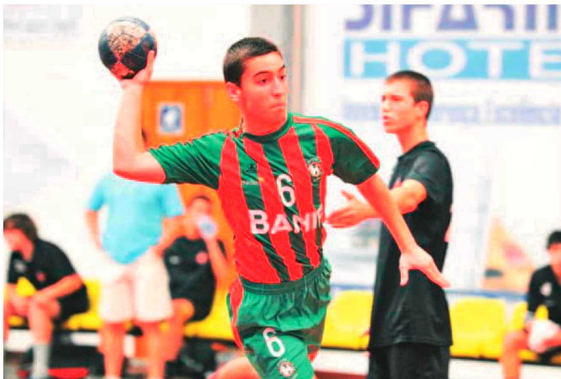
Duelos dos 'campeões' disputam-se hoje durante a tarde no Pavilhão do Funchal.