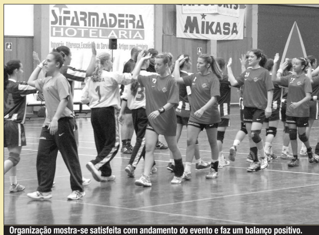
Organização mostra-se satisfeita com andamento do evento e faz um balanço positivo.

«Vale sempre o esforço e dedicação para organizar o torneio. Apesar das enormes dificuldades que esta-