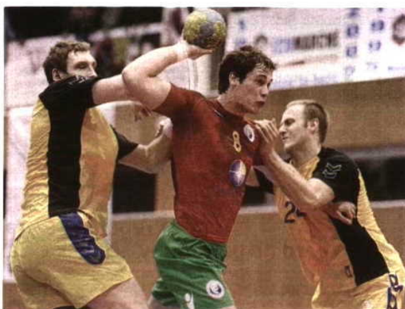
9 de Março Portugal bateu a Ucrânia por 28-16

voritos à vitória na poule", sublinhou Mats Olsson, perspectivando uma campanha em que se pretende recuperar o apuramento para a fase final de uma competição internacional, algo que não sucede desde 2006. M.P.