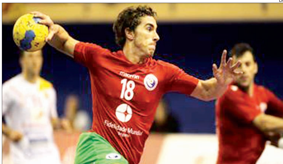
Portugal fez um bom teste no Qatar

A seleção portuguesa de andebol alcançou ontem a segunda vitória no Torneio do Qatar, a decorrer até hoje em Doha, ao derrotar a congénere anfitriã por 27-24 e sagrou-se já virtual vencedora da competição