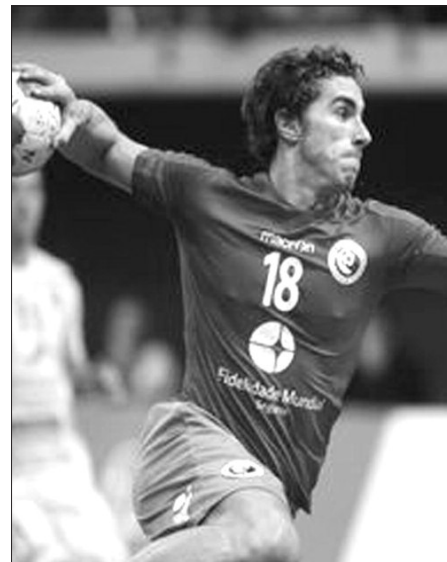
A Selecção Nacional Sénior masculina compete até hoje em Doha.