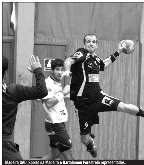
Madeira SAD, Sports da Madeira e Bartolomeu Perestrelo representados.