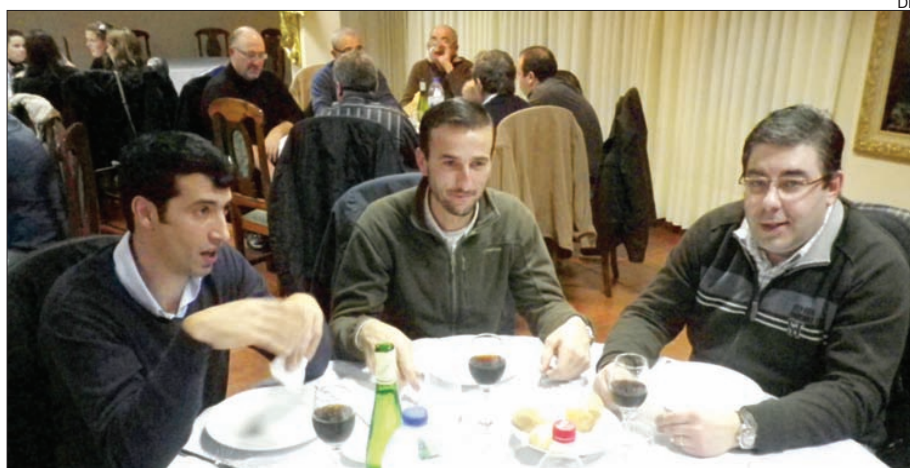
Ceia de Natal juntou família do andebol feminino do Centro Social Juventurde de Mar

O autarca referiu-se ainda ao apoio e disponibi-